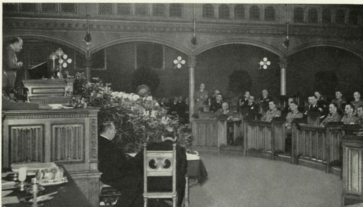
Die erste Ratsherrensitzung im Wiener Rathaus