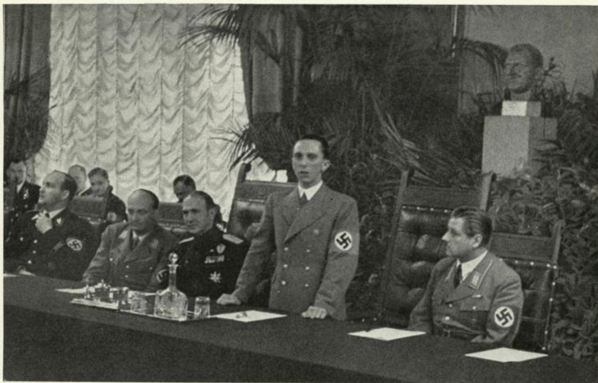
Reichsminister Dr. Goebbels spricht auf der Tagung der Reichstheaterkammer im Wiener Rathaus am 5. Juni 1939