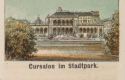
Cursalon im Stadtpark