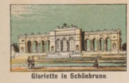
Gloriette in Schönbrunn