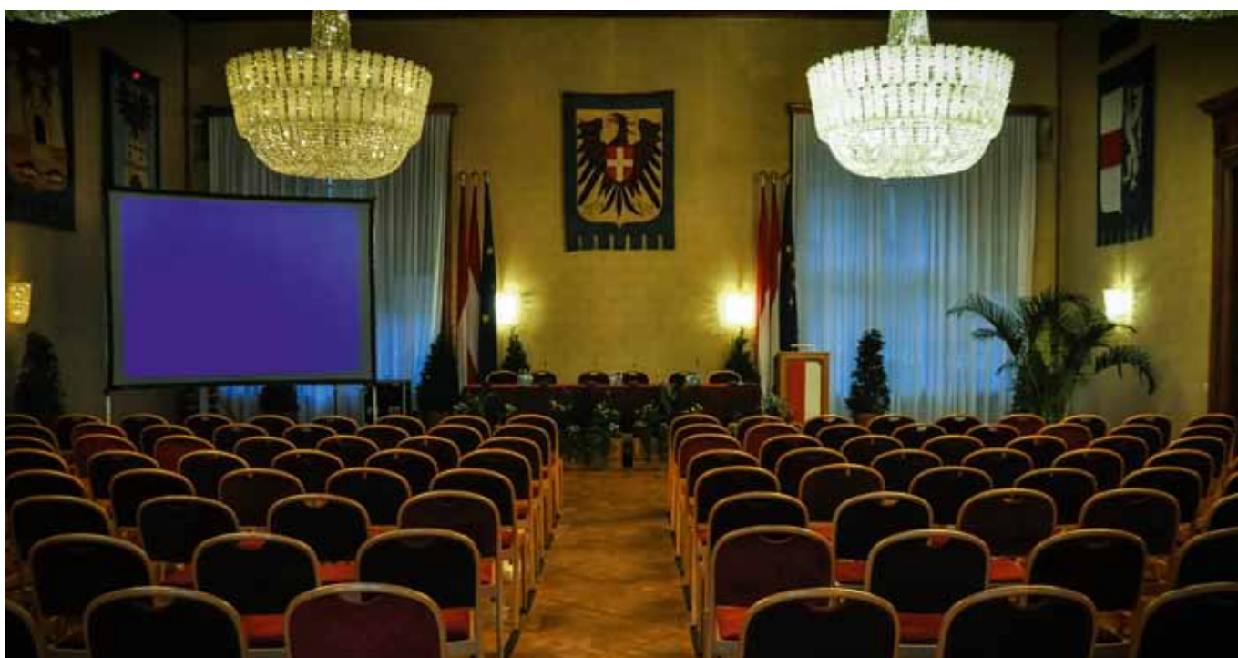
Wappensaal im Rathaus