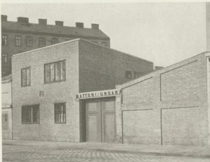
Garagebau mit Verwaltungsgebäude in Wien, XX. Bezirk, 1926 Rohziegel, grüner Holzanstrich