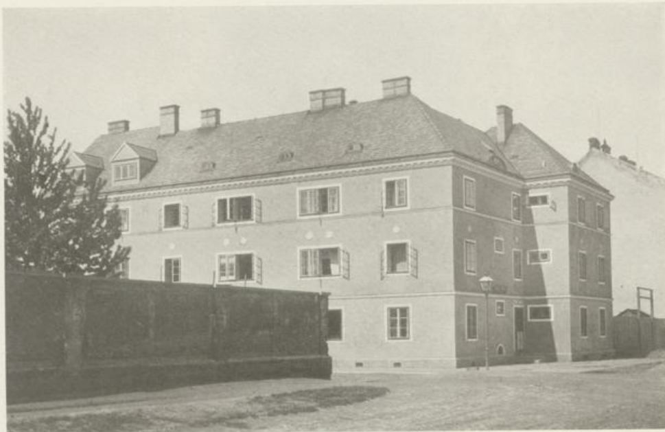
Wohnhaus für Fabriksangestellte, Wien, XXI. Bezirk, 1923