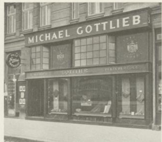
Wien I., Franz-Josefs-Kai

Zwei Holzfassaden an einem Haus, daher durchgehende Höhen in der horizontalen Gliederung