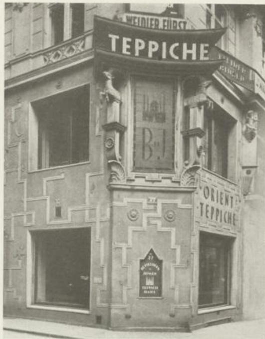
Wien I., Rotenturmstraße