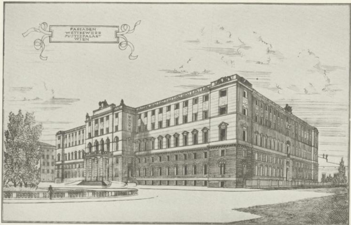
Wettbewerbsentwurf für den Stockwerksaufbau des Justizpalastes in Wien, 1929 Ein Vorschlag, das schwere Hauptgesimse abzutragen und das oberste Geschoß mit dem neu aufzubauenden zusammenzufassen