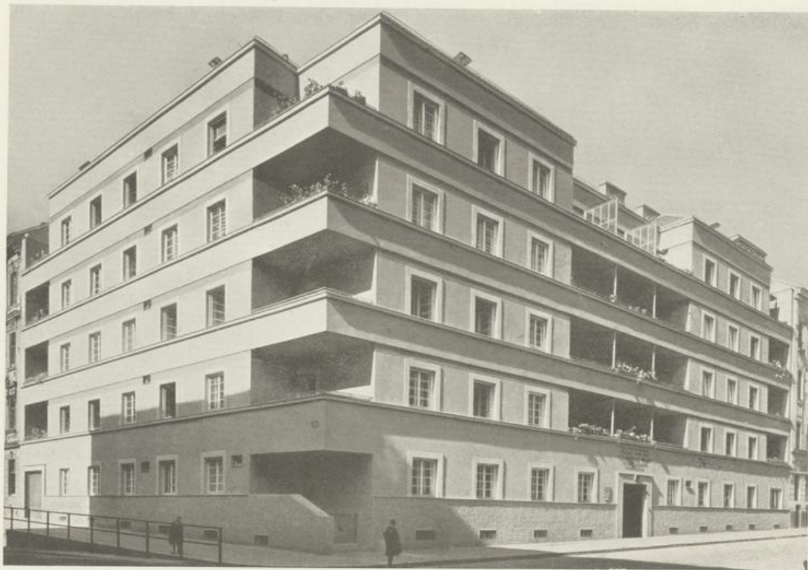
Ansicht von Südosten