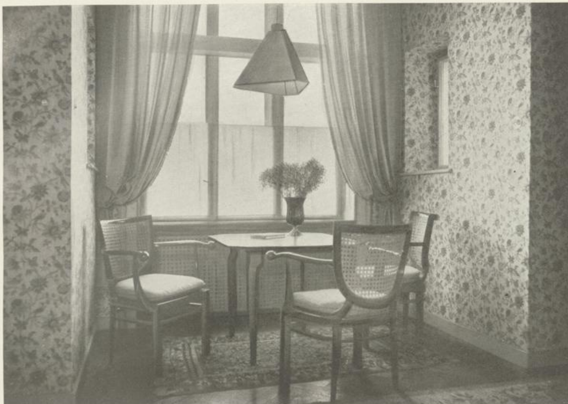
Erker im Schlafzimmer