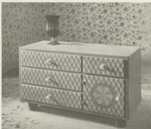
Möbel aus dem Schlafzimmer Grün lackiert, teilweise mit Flächenmuster Ton in Ton, Tischplatten Nußholz mit Einlagen