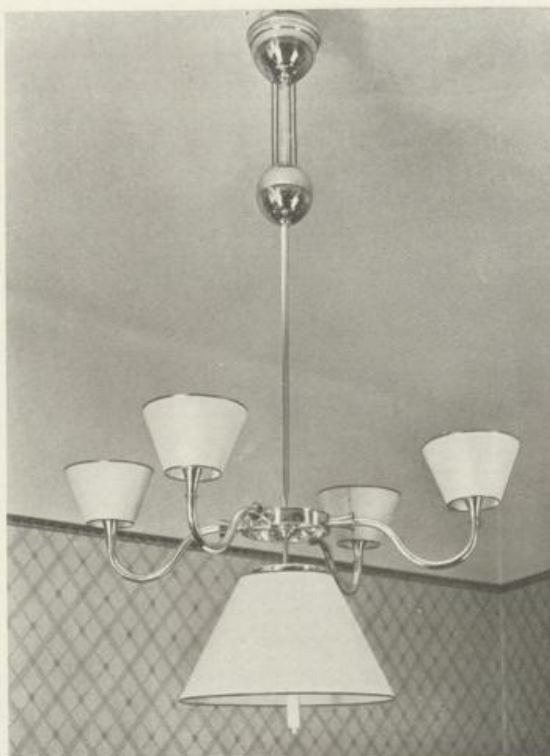
Zuglampe für ein Eßzimmer

Meist wird eine diffuse aber starke Aufhellung des Raumes zu einer tagähnlichen Atmosphäre angestrebt werden. Aber auch die isolierte, lokale Beleuchtung können wir prägnanter und wechsellvoller gestalten. In jedem Falle muß Blendung vermieden werden. Vervoll-