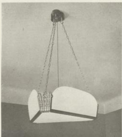
Deckenbeleuchtungen in Direktionsbüros