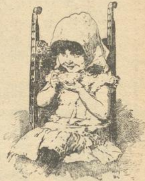
Mir pfundell er am boffen!

Alle die ihre Gesundheit erhalten und festigen und doch nicht auf den gewohnten, angenehmen Kaffee-Genuss verzichten wollen. Denn ein Zusatz von Kathreiner-Kaffee hebt die allgemein bekannte und namentlich bei regelmäßigem Genuss so gesundheits-schädliche Wirkung des nervenerregenden Bohnenkaffees auf. *****