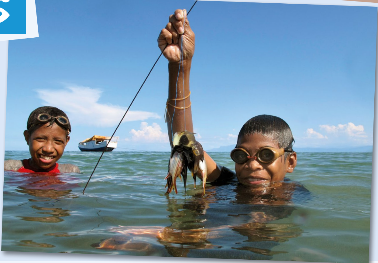
SDG 14 zielt auf den Schutz bzw. die nachhaltige Nutzung von maritimen Ökosystemen und Küstengebieten. Vor allem für kleine Inselstaaten ist das ein wichtiges Ziel. Das Bild zeigt junge Fischer vor dem Insel Atauro in Osttimor.

G ut 91 Millionen Tonnen Fisch wurden 2012 den Meeren und den Binnengewässern entnommen. Diese Menge überfordert weithin die Fischbestände. Viele Arten (wie Alaska-Seelachs, Thunfisch oder Schellfisch) sind zumindest in bestimmten Regionen in ihrem Bestand gefährdet und können sich nicht mehr ausreichend regenerieren. Ein Großteil dieser Massenfänge geht auf wenige Fischerei-Nationen zurück, die mit Groß-Trawlern und riesigen Fangnetzen die Meere effektiv leerfischen und den lokalen FischerInnen wenig Chancen lassen. Rund die Hälfte aller Fischexporte hat die EU zum Ziel.