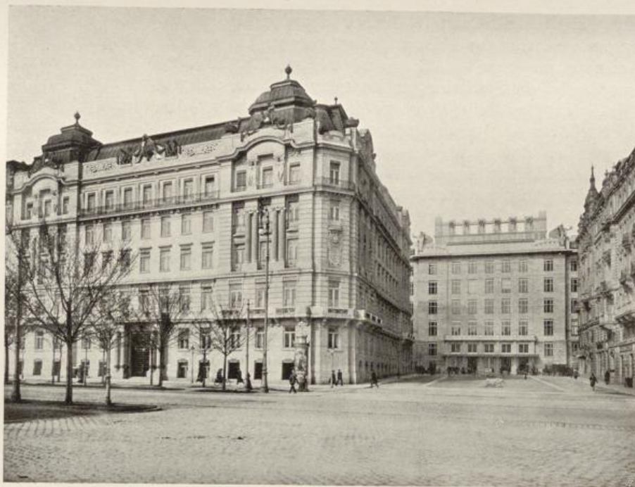
Handels- und Gewerbekammer.