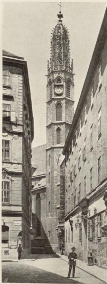
Kirche Maria am Gestade.

Während die Weingärten bis auf wenige Reste in Matzleinsdorf, Altlerchenfeld u. s. w. verschwanden und 1847 auch mit der Verschüttung der Mühlbäche des Wienflusses begonnen wurde, erhoben sich in den Vorstädten zahlreiche Fabriksschlote und wurden die ersten primitiven (seither umgebauten) Bahnhöfe erbaut (1836 Nordbahnhof, 1841 Südbahnhof).