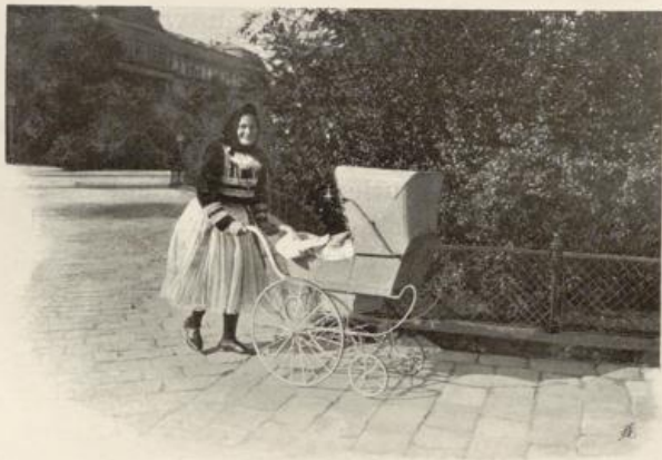
Hannakin mit Kinderwägelchen.

Die heute so wichtigen Universitätsseminare beschränkten sich 1850 auf das philosophisch-historische Seminar und das Physikalische Institut, die damals errichtet, beziehungsweise reorganisiert wurden; außerdem besaß die Universität aus der theresianisch-josephinischen Zeit die Sternwarte, das naturhistorische Universitätsmuseum und eine Sammlung anatomischer Präparate, der sich 1812 das anatomisch-pathologische Museum und später eine ophthalmiatische Sammlung zugesellte. Auch bestand an der chirurgischen Josefs-Akademie eine anatomische Sammlung, welche u. a. die berühmten, noch heute vorhandenen