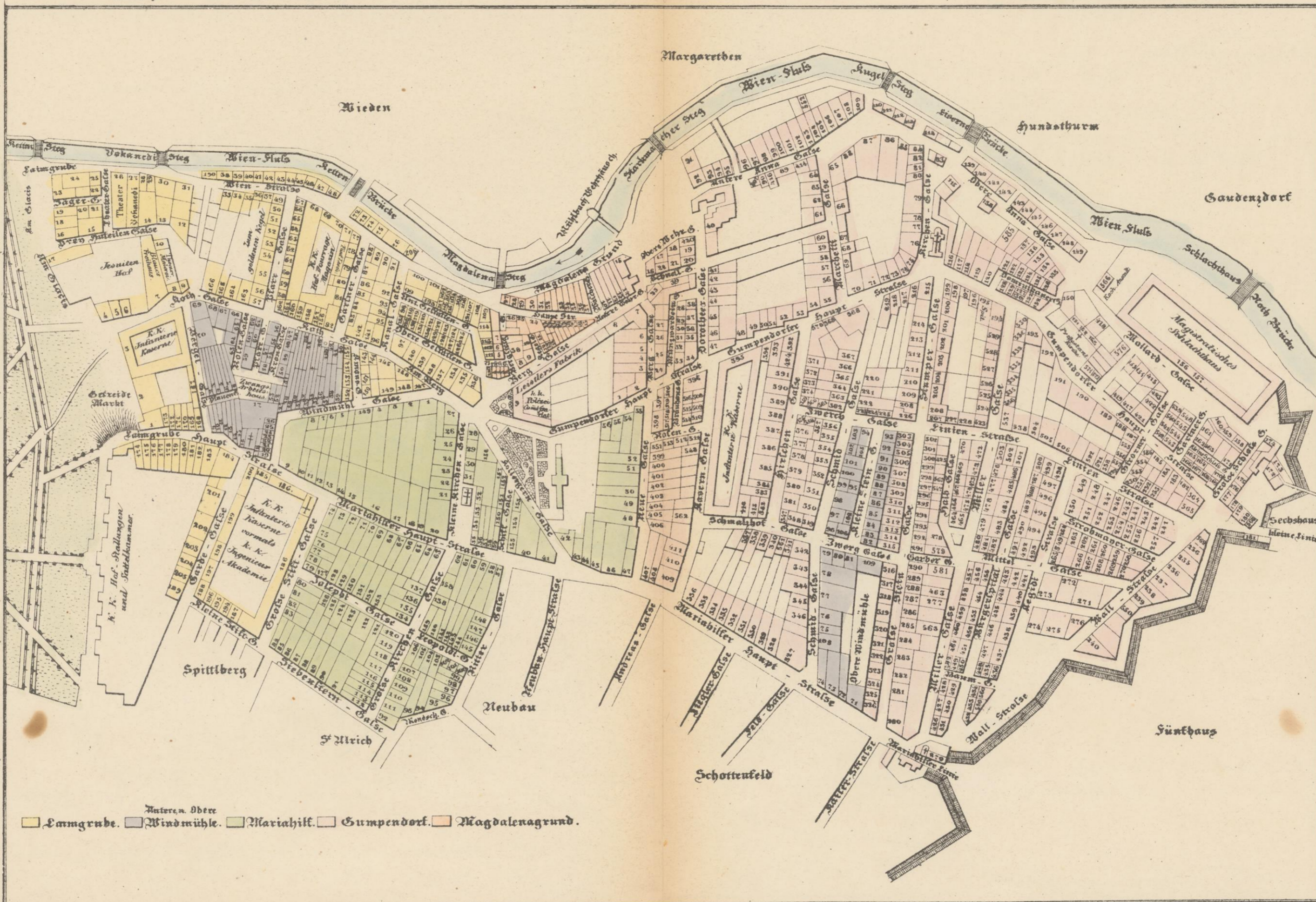
Antere Obere. Lainzgrube. Windmühle. Mariahilf. Gumpendorf. Magdalengrund.

Für Mariahilf in der Schiffgasse No. 153. Für die obere und untere Lainz in der Rothgasse No. 145. Für die obere und untere Windmühle in der Krongasse No. 54. Für Gumpendorf in der Hauptstrasse No. 196, im Gemeindegau. Für den Magdalengrund in der Rothgasse No. 145.