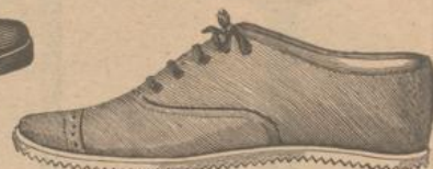
92. Lawn-Tennis-Schuhe aus lichtgelbem Kalbleder für Herren fl. 9.—, für Damen fl. 8.—.