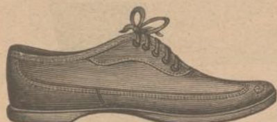
91. Lawn-Tennis-Schuhe aus braunem, weichem Kalbleder für Herren fl. 9.50, für Damen fl. 7.—.