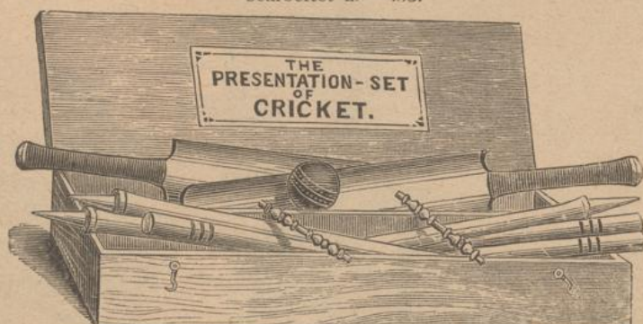
96. Cricket-Spiele (complet) in Kisten eingerichtet fl. 12.50, 8.50.