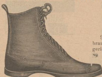
89. Lawn-Tennis-Schuhe, hohe Form, aus braunem Kalbleder, für Herren per Paar fl. 12.—, für Damen per Paar fl. 10.80. 89a. Dieselben aus lichtgelbem Kalbleder mit feinsten Lysandersohle (sehr leicht) per Paar für Herren fl. 16.25, für Damen fl. 12.80.