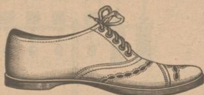
90. Lawn-Tennis-Schuhe aus weissem Rehlleder für Herren fl. 9.50, für Damen fl. 7.50.