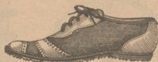
93. Lawn-Tennis-Schuhe (Canevas) braun oder weiss, mit Lederbesatz und gerippter Gummisohle, für Herren fl. 5.80, für Damen fl. 4.80.