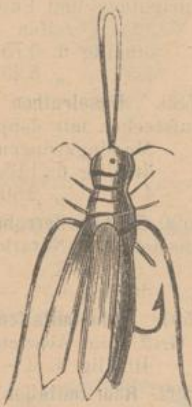
1613. Insecten per Dutzend in Cartons sortirt, mit 3 Angeln an Seidendarm fl. —.55.

1610. Fliegen an Seidendarm per Dutzend fl. —.45, 1.—.