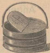
282. Fischwannen aus Blech (lackirt) fl. 1.10, 1.40, 1.70, 2.—.

1607. Limerick-Angeln, an Seidendarm mit Schlingen, von Nr. 1—12, per Dutzend fl. —.45.