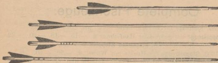
297. Pfeile mit Stahlspitzen und dichten Federn fl. —.10, —.15, —.25, —.35, —.55.

296. Einfache Bögen fl. —.35, —.45, —.60, —.80, 1.20, 2.—.