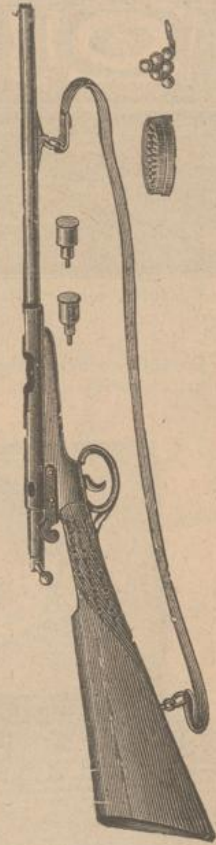
322. Mannlicher-Gewehr feinst vernickelt) mit leichten Holzbolzen zu schießen (Kapselschuss), ohne Munition fl. 9.—.