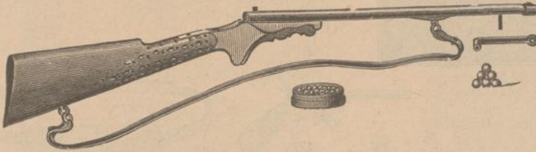
324. Feinst vernickeltes Gummiballgewehr mit Kapselschuss, ohne Munition fl. 6.—. 326. Munition für Gummiballgewehre: 1 Dutzend Gummibälle fl. —.40, —.60. 100 Kapseln fl. —.10