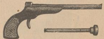
344. Vacuum-Pistolen mit einem Projectil und einer Scheibe, lackirt fl. —.90., vernickelt fl. 1.10.