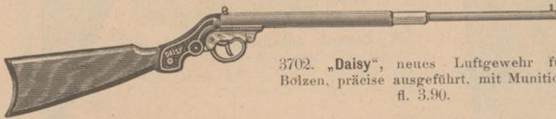
3702. „Daisy“, neues Luftgewehr für Bolzen, präzise ausgeführt, mit Munition fl. 3.90.