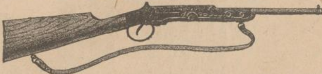
346. Vacuum-Gewehr mit einem Projectil und einer Scheibe, lackirt fl. 2.40, vernickelt fl. 2.70.