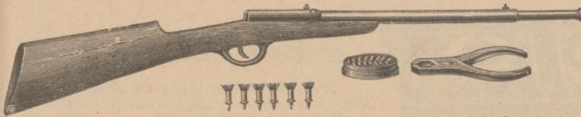
316. Bolz- und Kugelgewehr (einfache Ladung), mit federndem Lauf, 1 Schachtel Spitzkugeln, 6 Bolzen und Bolzenzieher fl. 6.20, 7.50.