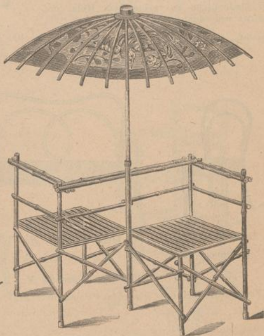
1485. Bambus-Doppelsessel, mit japanischem Schirm zum Abnehmen fl. 8.50.