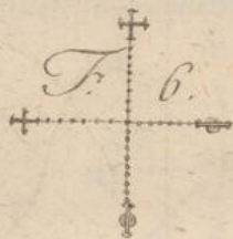
Das Kreuz in 4.