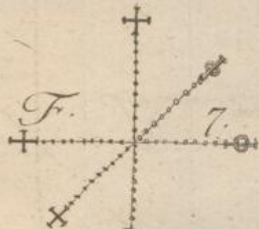
Das Kreuz in 6.