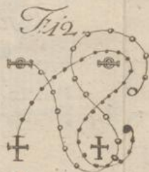
Das doppelte Es.