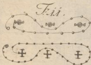
Die doppelte Promenade.