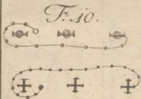
Die einfache Promenade.