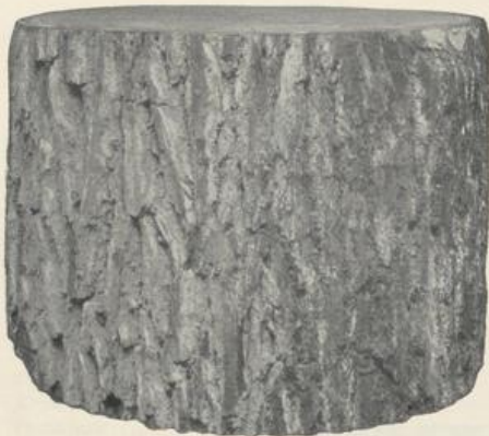
Figur D4. Kabelwort: Dalon .