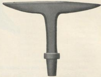
Figur D8. Kabelwort: Damages .

Diese Sperrhörner werden wie die Ambosse auf Seite 405 in ganzer Schweißung des Kerns usw. geliefert.