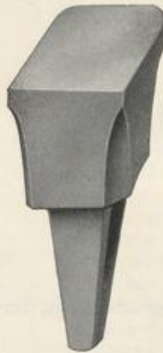
Figur D7. Kabelwort: Damaccia .

Matt poliert, mit einer abgerundeten Kante. No. 1 hat 2 scharfe und 2 runde Ecken, No. 2 hat 3 scharfe und 1 runde Ecke. Bahngröße 60-150 mm.