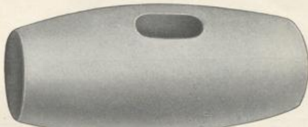
Figur D45. Kabelwort: Dammargum.