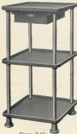
Figur D 53.

Die nebenstehend abgebildeten, äußerst praktischen und dauerhaften Tische eignen sich sehr vorteilhaft zum Ablegen von Werkzeugen, Materialien usw. und sollten in keiner Werkstätte fehlen. Das Gestell ist 970 mm hoch. Es besteht aus Gasrohren, die durch gußeiserne Platten von 500 mm im Quadrat versteift sind.