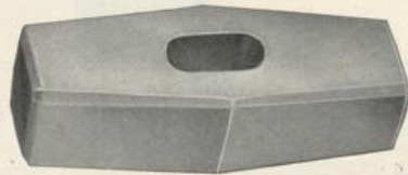
Figur D46. Kabelwort: Dammario.