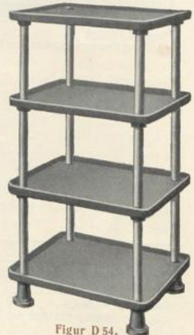
Figur D 54.