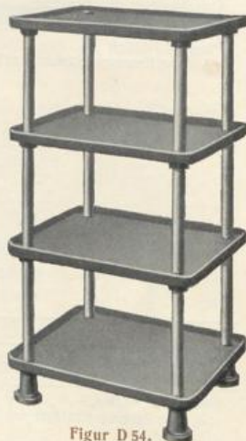
Figur D 54.