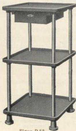
Figur D 53.

Die nebenstehend abgebildeten, äußerst praktischen und dauerhaften Tische eignen sich sehr vorteilhaft zum Ablegen von Werkzeugen, Materialien usw. und sollten in keiner Werkstätte fehlen. Das Gestell ist 970 mm hoch. Es besteht aus Gasrohren, die durch gußeiserne Platten von 500 mm im Quadrat versteift sind.