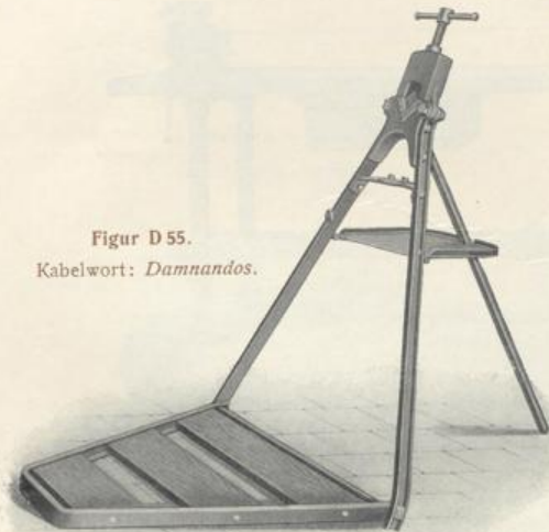
Figur D 55. Kabelwort: Dammandos.