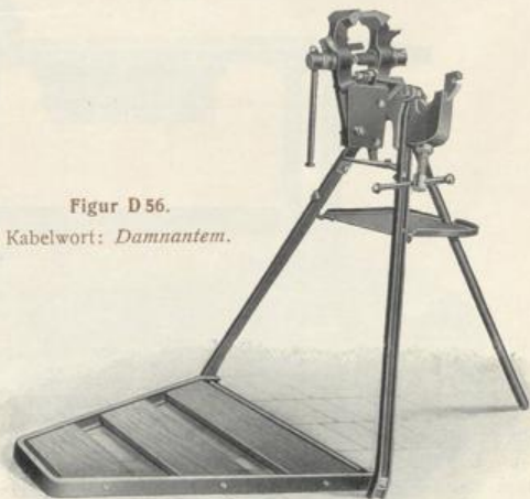
Figur D 56. Kabelwort: Damnantem.

Diese praktischen Arbeitständer sind zusammenlegbar und leicht zu transportieren. Vorgestell und Standflächenrahmen bestehen aus L-Eisen. Die Seitenstreben sind mit der aus Gasrohr hergestellten Stütze durch eine eiserne Tischplatte gelenkartig verbunden.