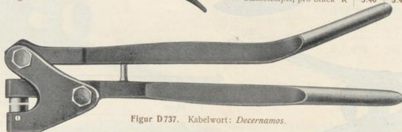
Figur D737. Kabelwort: Decernamos.

Diese Zangen sind kräftiger als die vorstehenden und werden für zweihändigen Gebrauch zum Plombieren von größeren Stückgütern, wie z. B. Säcken, Kisten, Fässern, Waggonen usw. benutzt.