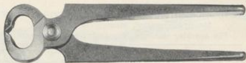
Figur D346. Kabelwort: Dattelotte.

Kneifzangen aus Gußstahl, mit blankem Kopf.