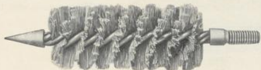
Figur D 497. Kabelwort: Debaccamo .