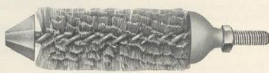
Figur D 498. Kabelwort: Debaccante .

Die Bürsten bestehen aus Bessemer-Stahlraht. Sie werden entweder ohne Glocke und Schutzstück, wie Figur D 497, oder mit Glocke und Schutzstück, wie Figur D 498, geliefert. Die Zapfen sind mit 1/2"-Gewinde versehen.