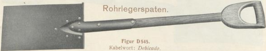
Figur D 545.