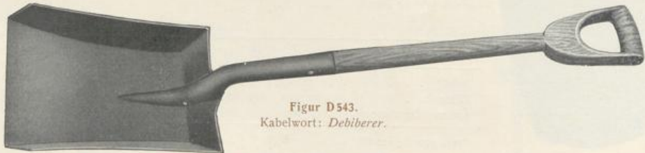
Figur D 543.