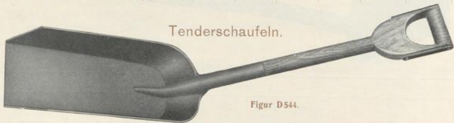
Figur D 544.

Mit offener Tülle, mit buchenem Griffstiel ohne oder mit Beschlag. Ganze Länge des Stiels bis zum Blatt 730 mm.