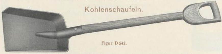
Figur D 542.

Mit kurzer Tülle, mit buchenem Griffstiel. Ganze Länge des Stiels bis zum Blatt 770 mm.