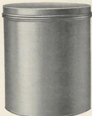
Figur D908. Kabelwort: Deciders.

Aus blankem Weißblech mit aus einem Stück gestanzten Deckel.