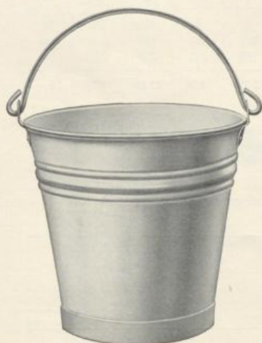
Figur D910. Kabelwort: Decidese.