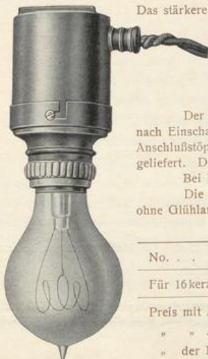
Figur D 674.

Das stärkere Ende kann bei Bestellung von mindestens 24 Stück einer Größe mit Bohrung und Fläche beliebigen Durchmessers versehen werden.