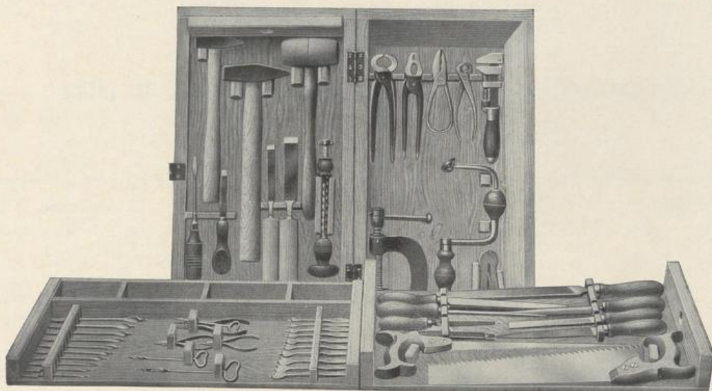
Figur D 695. Kabelwort: Decendium .