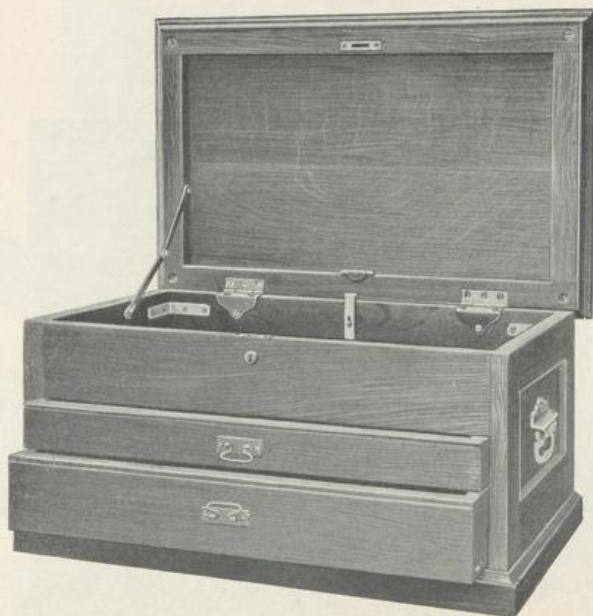
Figur D693. Größe No. 1.

Diese Werkzeugkasten dienen zur Aufbewahrung von feineren Werkzeugen. Sie sind aus ausgesuchten harten Hölzern hergestellt, mit amerikanischem Schloß und Schlüssel versehen und haben vernickelte Beschläge. Mit oberem Gefach und Deckelstütze. Die Schubladen werden durch das Schließen des Deckels gleichzeitig automatisch verschlossen.