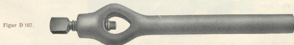
Figur D 107.