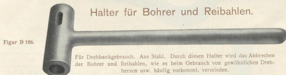
Figur D 106.