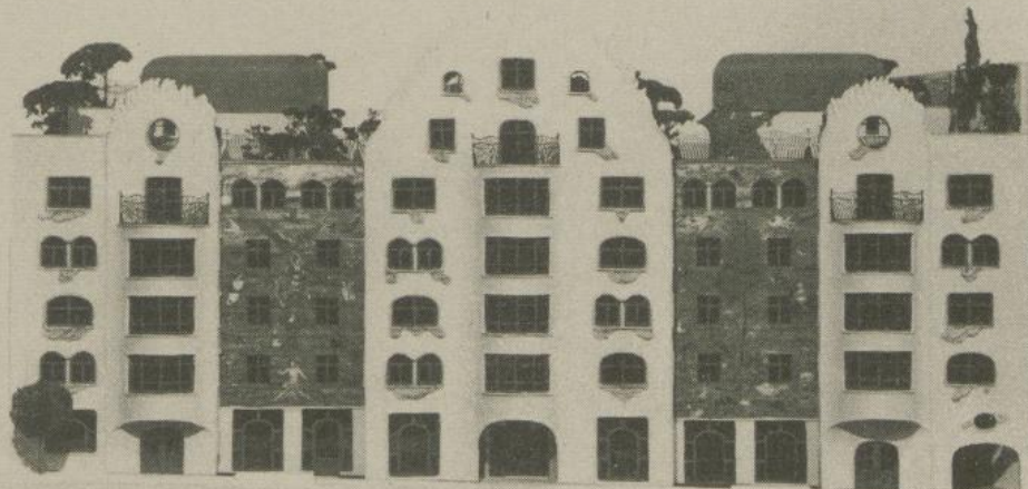
Das Modell des Brauer-Hauses

Der Innenhof ist als Garten mit Teich und einer von Brauer gestalteten, drei Meter hohen Keramiksäule konzipiert. Außerdem wird hier auch ein Kleintierstall vorgeschlagen. (Forts. mgl.) ger/rr