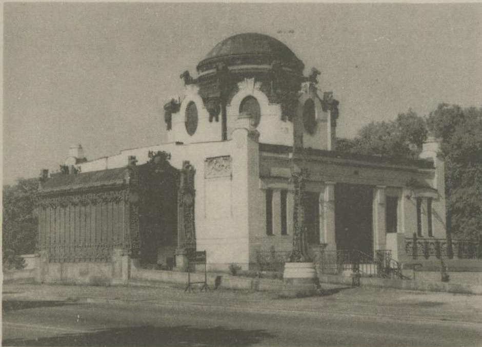
Der Hofpavillon Hietzing

Der 1898 im Zuge der Errichtung der Wiener Stadtbahn erbaute Hofpavillon wird nach seiner Renovierung den Museen der Stadt Wien zur Verfügung stehen. Er soll für kleinere Ausstellungen und kulturelle Veranstaltungen genützt werden. (Schluß) gab/gg