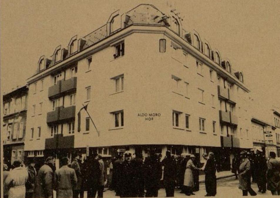
Die städtische Wohnhausanlage Antonigasse 41 — Leitemayergasse 26 in Währing wurde nach dem 1978 ermordeten italienischen Politiker Aldo Moro benannt.

Die Benennung der Wohnhausanlage fand unter reger Teilnahme lokaler Politiker und der Bevölkerung statt. Die Wohnhausanlage umfaßt 20 Wohnungen und eine Mutterberatungsstelle und zählt zu jenen architektonisch ansprechenden Bauwerken, die auch als wichtiger Beitrag zur Stadterneuerung zu verstehen sind. (Schluß) ah/rr