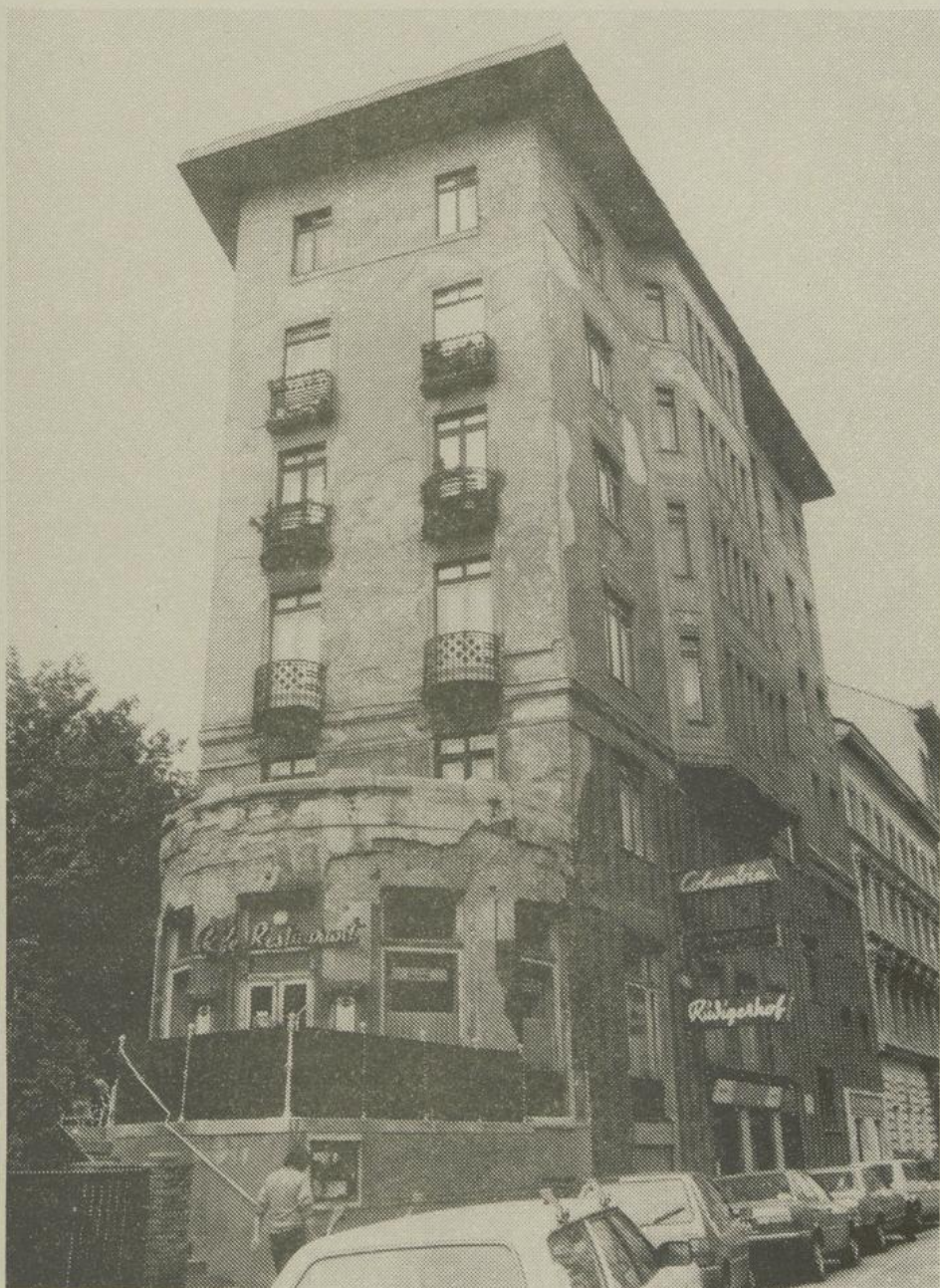
Das Haus Hamburgerstraße 20, das in seiner kubischen Architektur typisch für den Wiener Sezessionismus ist, wird mit Hilfe des Wiener Altstadterhaltungsfonds renoviert.

Wien, 15.6. (RK-KULTUR) Das Haus Hamburgerstraße 20, das in seiner kubischen Architektur typisch für den Wiener Sezessionismus ist, wird mit Hilfe des Wiener Altstadterhaltungsfonds renoviert. Das weithin sichtbare Dreifrontenhaus von großer städtebaulicher Bedeutung wurde um die Jahrhundertwende von Oskar Marmorek erbaut, der zur ersten Generation der Wiener Sezessionsarchitekten zählte. Der Altstadterhaltungsbeirat genehmigte einen Zuschuß von 1,8 Millionen Schilling zur Renovierung des Hauses. (Schluß) gab/rr