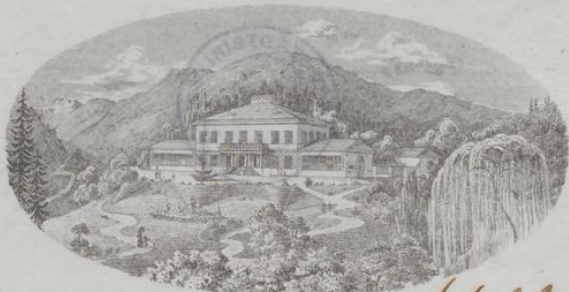
Berghof zu Lilienfeld.