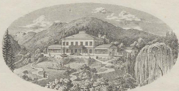
Berghof zu Lilienfeld.