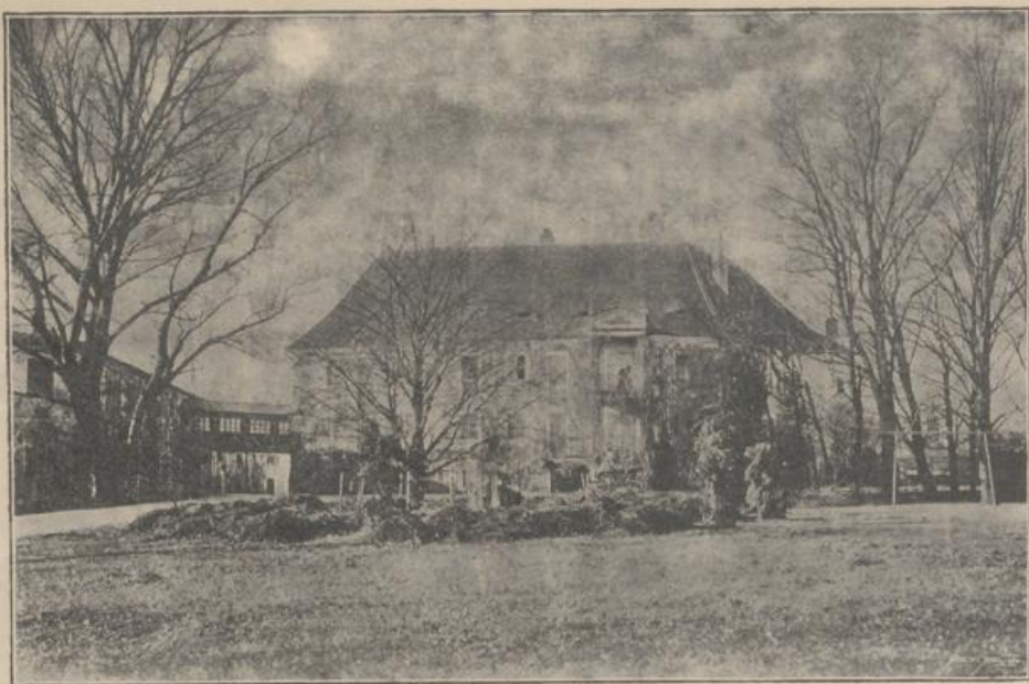
Schloss Ronsperg. Böhmen 1902. 28 October.