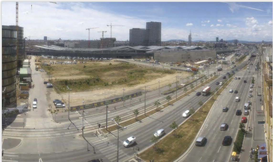
Der fertige Wiedner Gürtel Richtung Westen mit den neu angelegten Grünstreifen. Die große Wand unter den Giebeln des Bahnhofsdachs ist die Außenwand der Bahnhofshalle. Hier wird ab Jänner 2015 das Projekt der Fa. Signa baulich direkt anschließen. Am großen, freien Baufeld entsteht das Quartier Belvedere Central