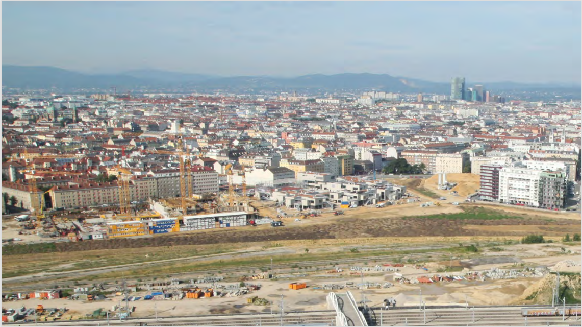
Im Baufeld mit den Kränen links errichtet die Sozialbau Wohnungen, rechts davon ist der schon fast fertige Bildungscampus Sonnwendviertel zu sehen. Davor schüttert die MA 48 gerade die Humusaufgabe für den Helmut-Zilk-Park