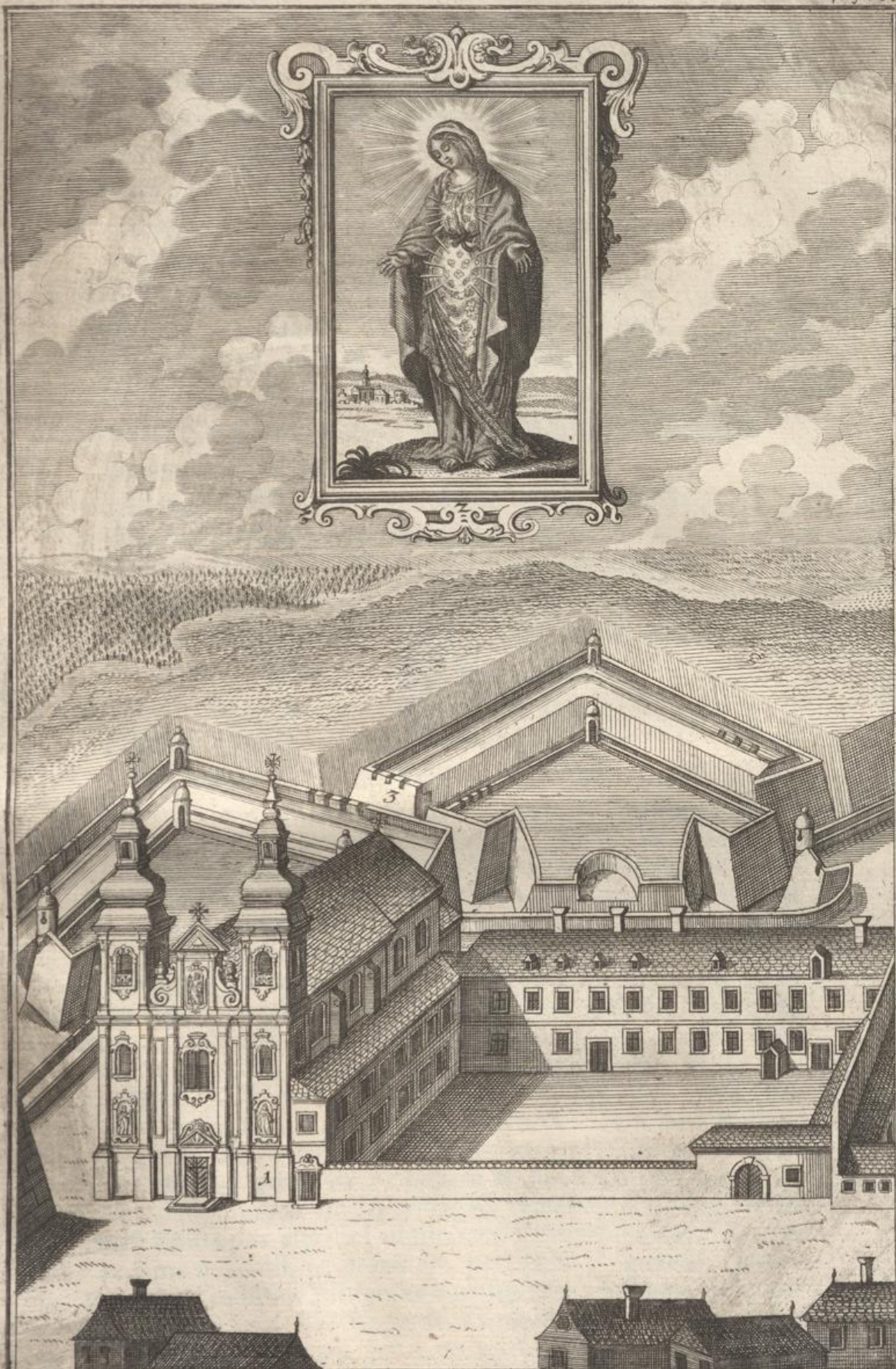
i Ecclesia et Domus nostra Albae Carolinae in Transilvania. z. Imago Beatissimae Virginis MARIAE, quae magna religione ibidem colitur 3. Monia S. Caroli Bormæi.