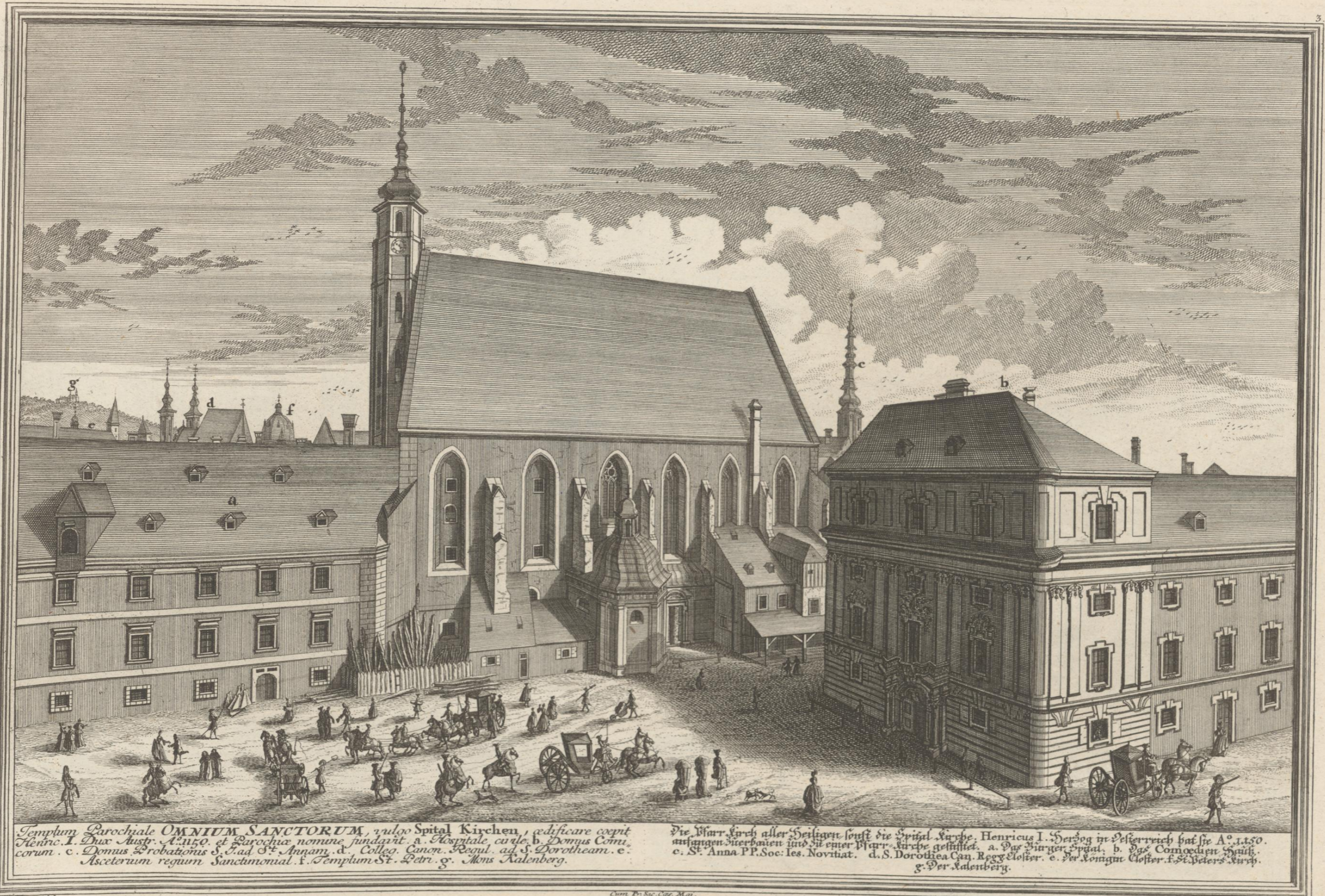
Templum Parochiale OMNIUM SANCTORUM, vulgo Spital Kirchen, edificare coepit Henric I. Dux Austr. A. 1150. et Parochia nomine fundavit a. Hospitale curie b. Domus Comi- corum. c. Domus Probationis S. ad S. Annam. d. Colleg. Canon. Regul. ad S. Dorotheam. e. Asceterium regum Sanctimonial. f. Templum St. Petri. g. Mons Kalenberg.