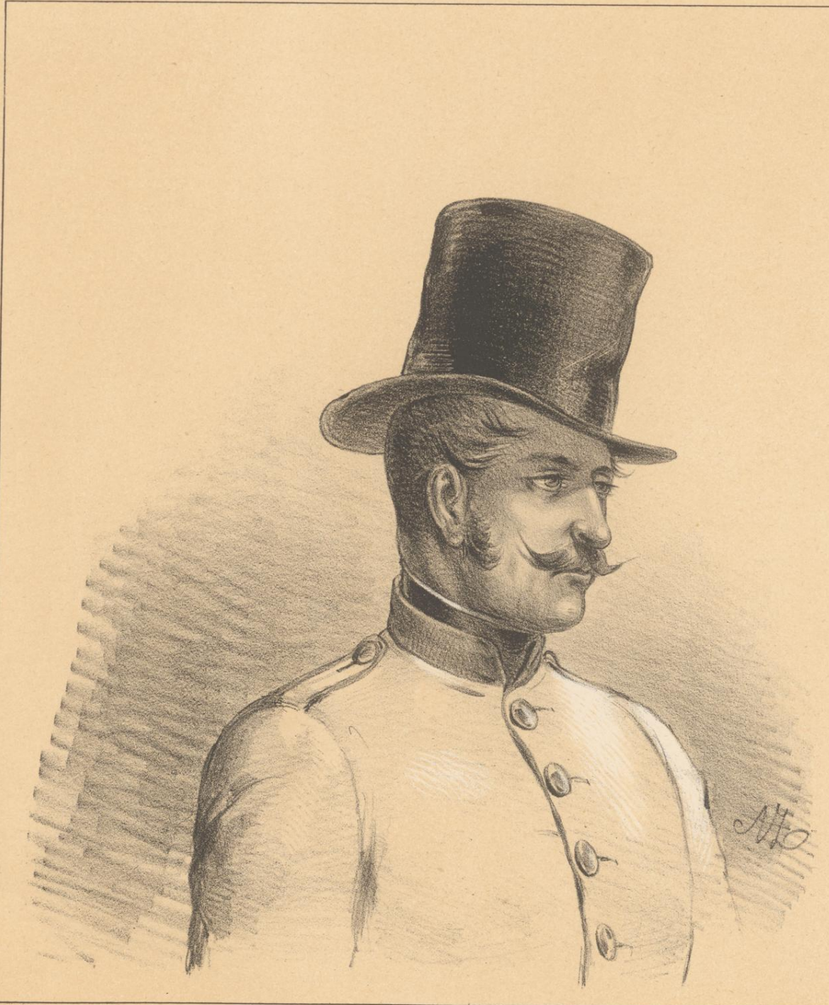
Hut eines Ueberläufers.