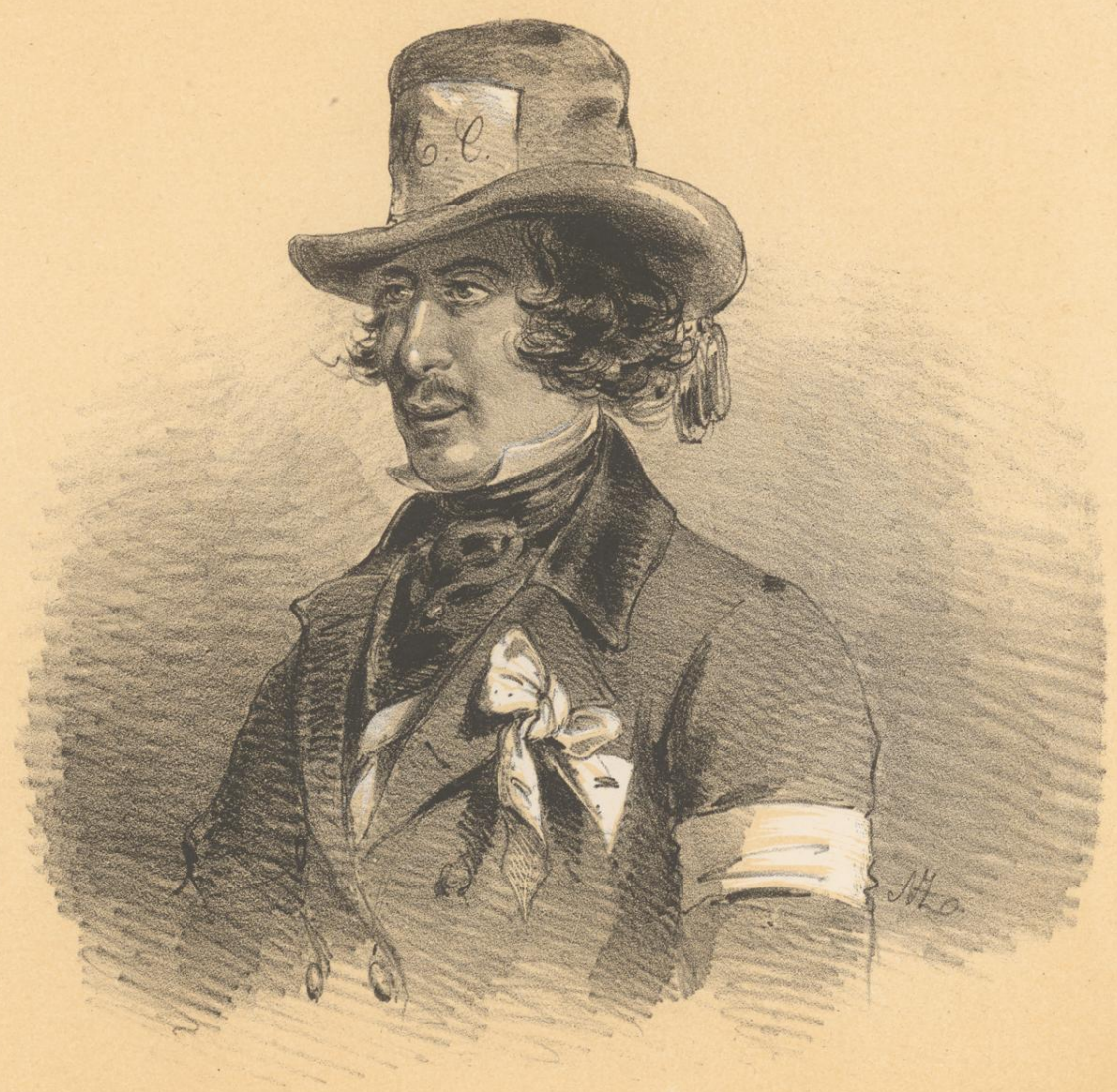
Studenten-Hut im März.