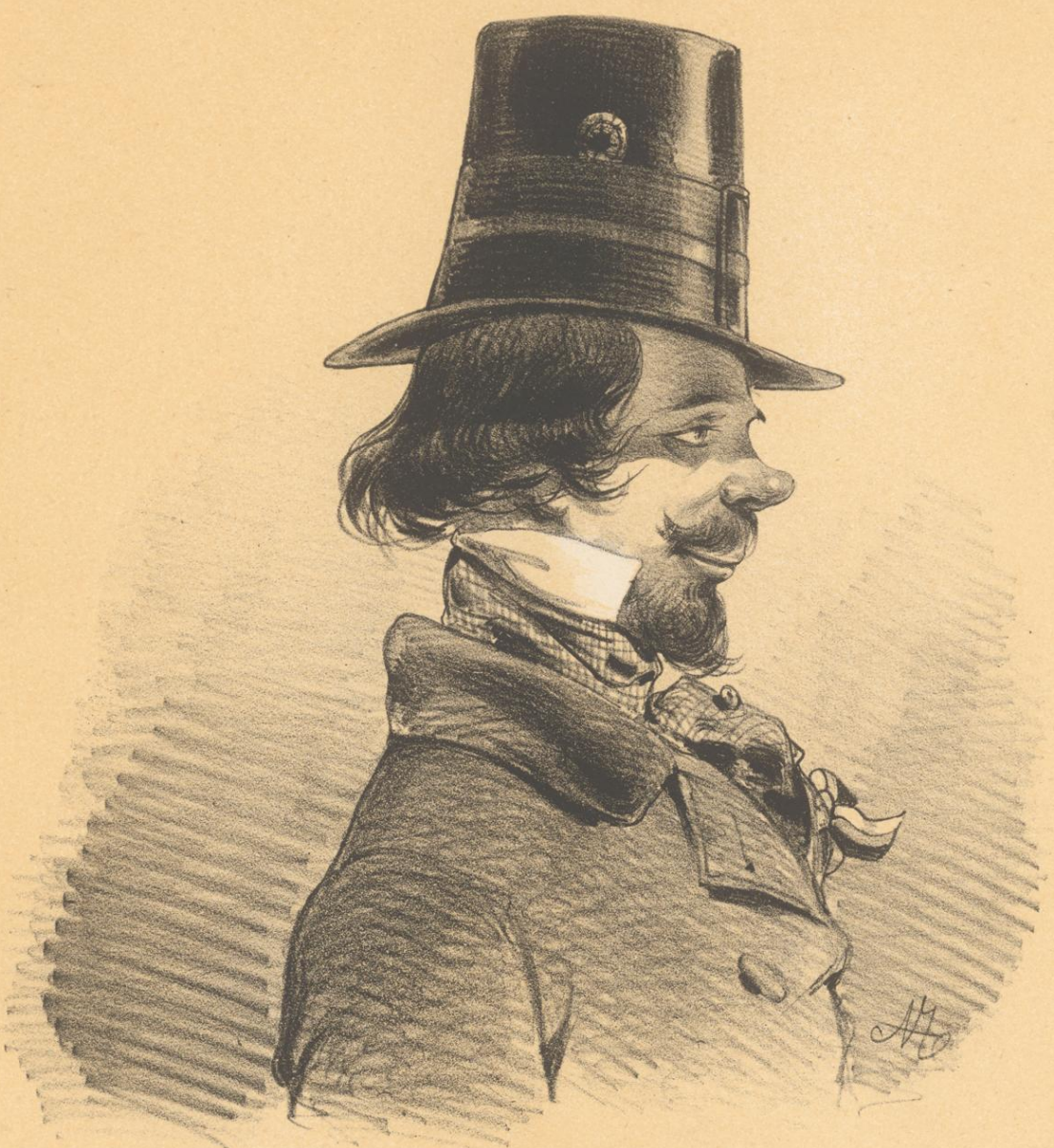
Cylinder muß erhalten zum deutschen Hut.