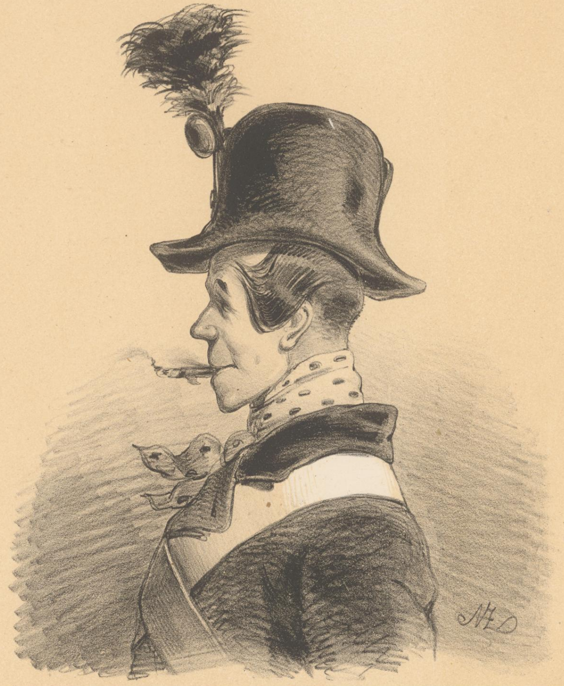
Ein aus der leeren Caserne eroberter Artillerie-Hut.