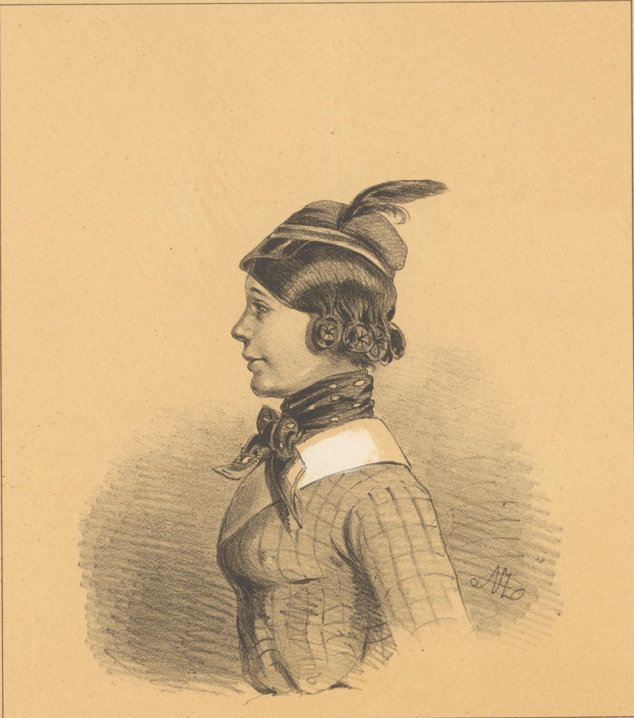
October-Nimphe mit Studenten-Kappe.