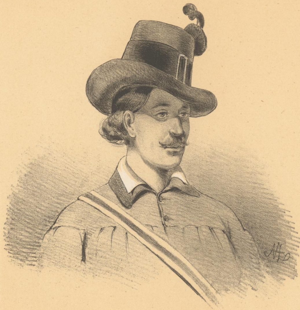
Steyerer - Hut.