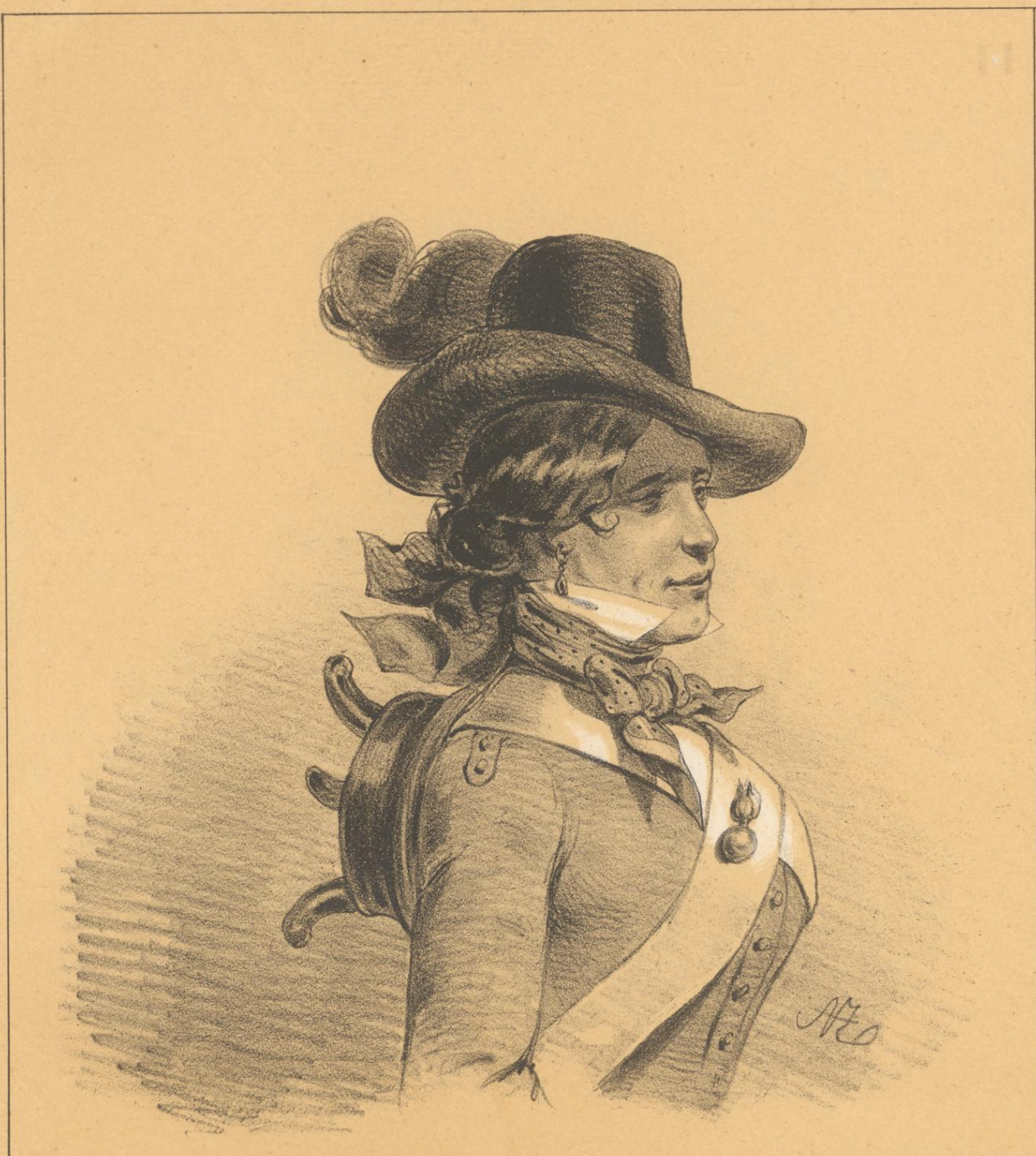
October-Nimphe mit Calabreser.