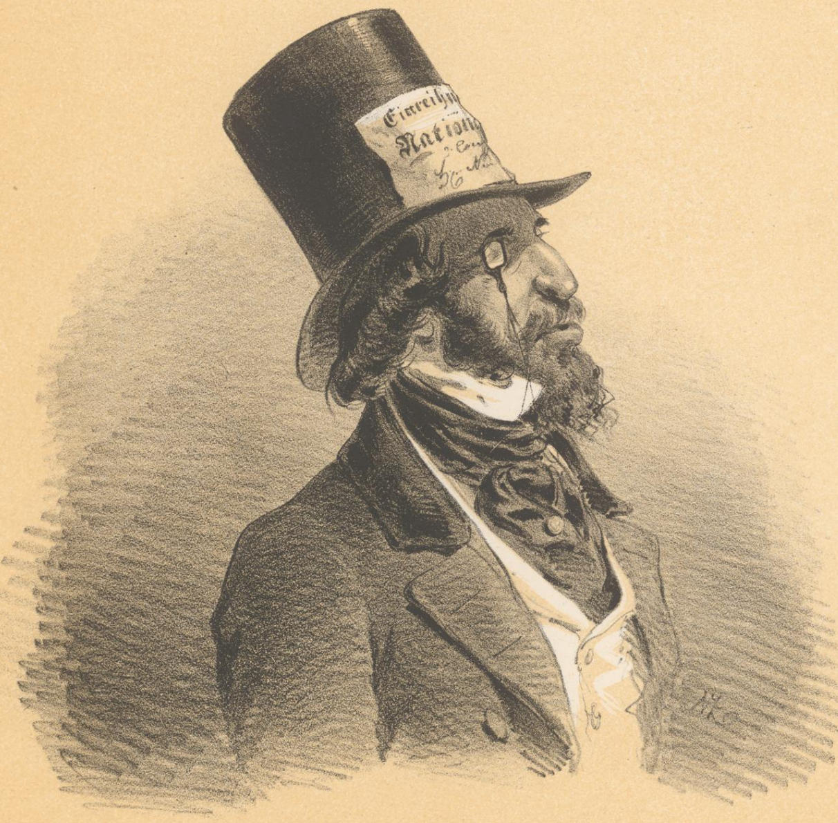
Hut mit Einreichungs-Karte für die National-Garde.