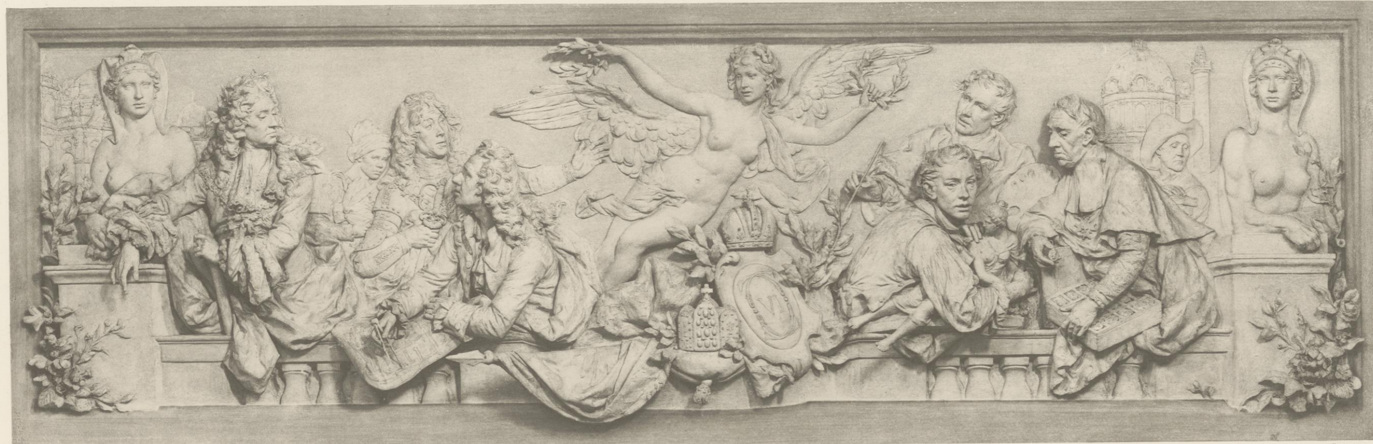
PROFESSOR RUDOLF WEYR SCULPS.