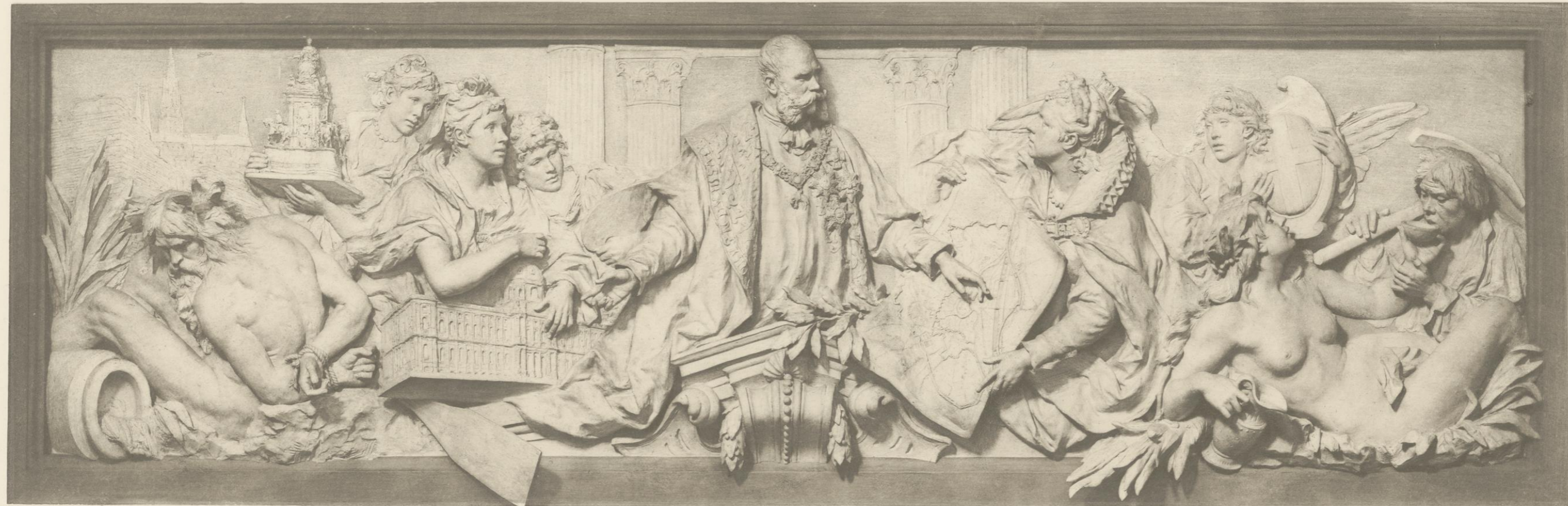
PROFESSOR RUDOLF WEYR SCULPS.