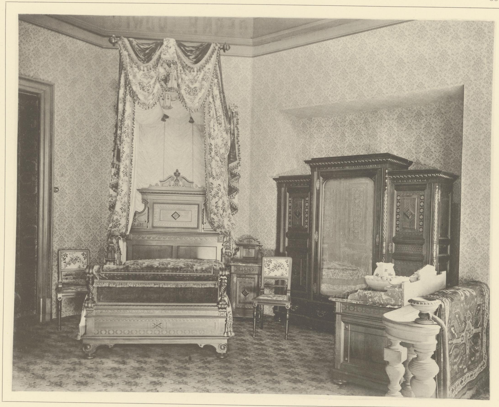
SCHLAFZIMMER AUS IMPRÄGNIRTEM ROTHBUCHENHOLZ MIT ANWENDUNG DER PATENTIRTEN BRANDTECHNIK (PYROTYPHE)