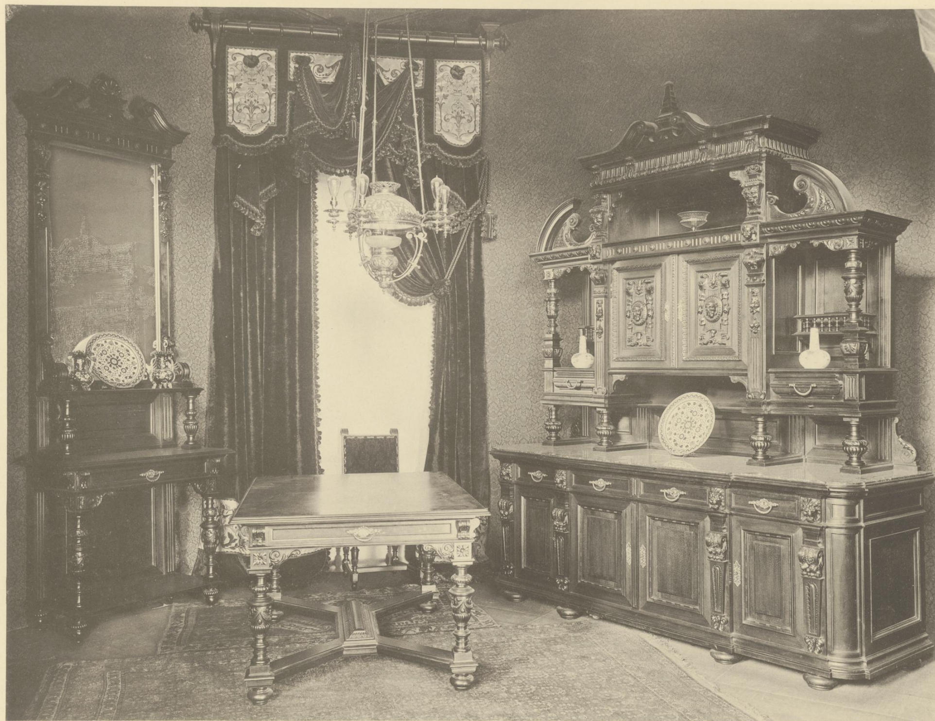
SPEISE-ZIMMER IM STYLE DER RENAISSANCE MIT ALTFRANZÖSISCHEN MOTIVEN