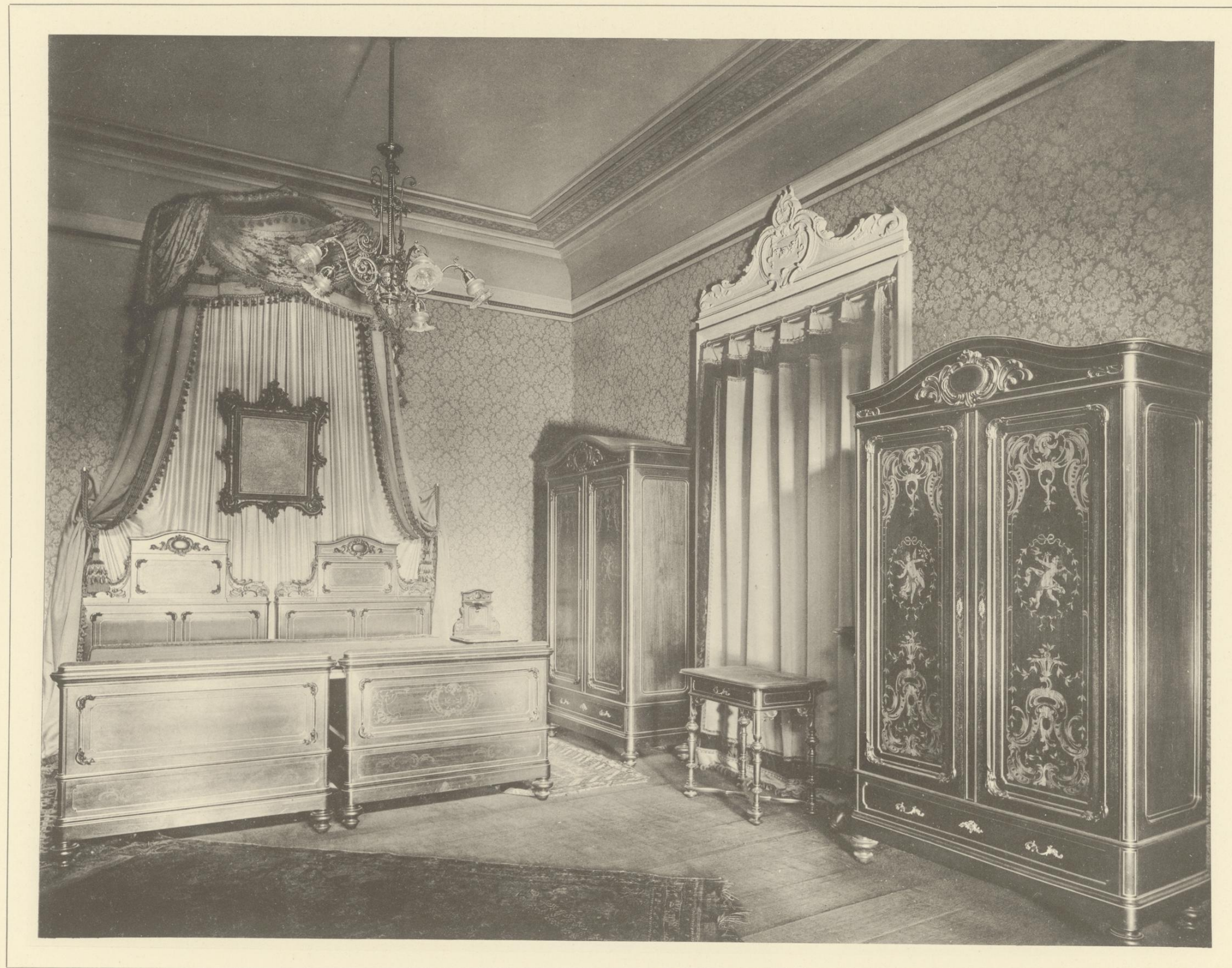
SCHLAFZIMMER IM GESCHMACKE DES ROCOCO-STYLS MIT INTARSIEN UND THEILWEISER VERGOLDUNG