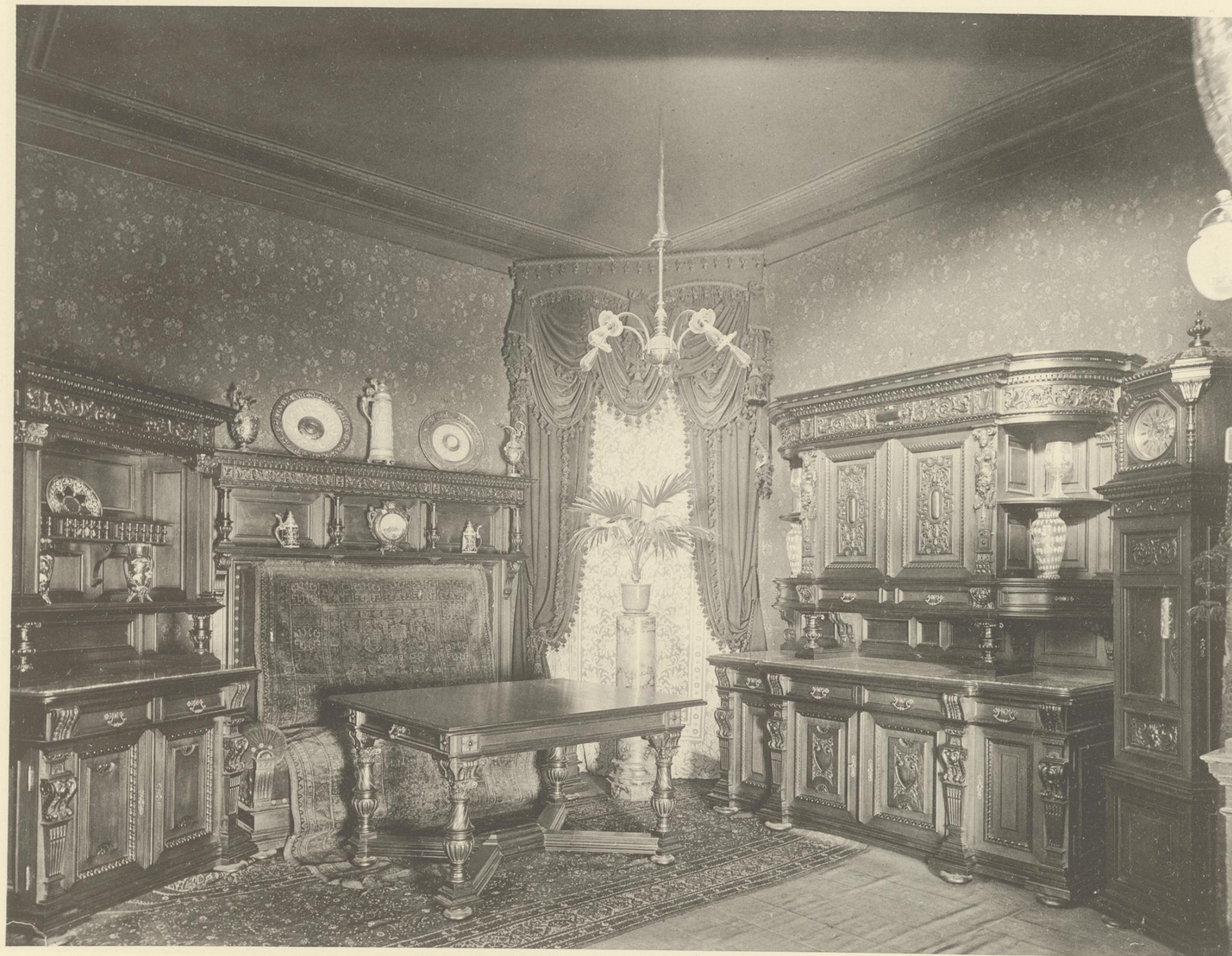
SPEISE-ZIMMER IN ITALIENISCHER RENAISSANCE