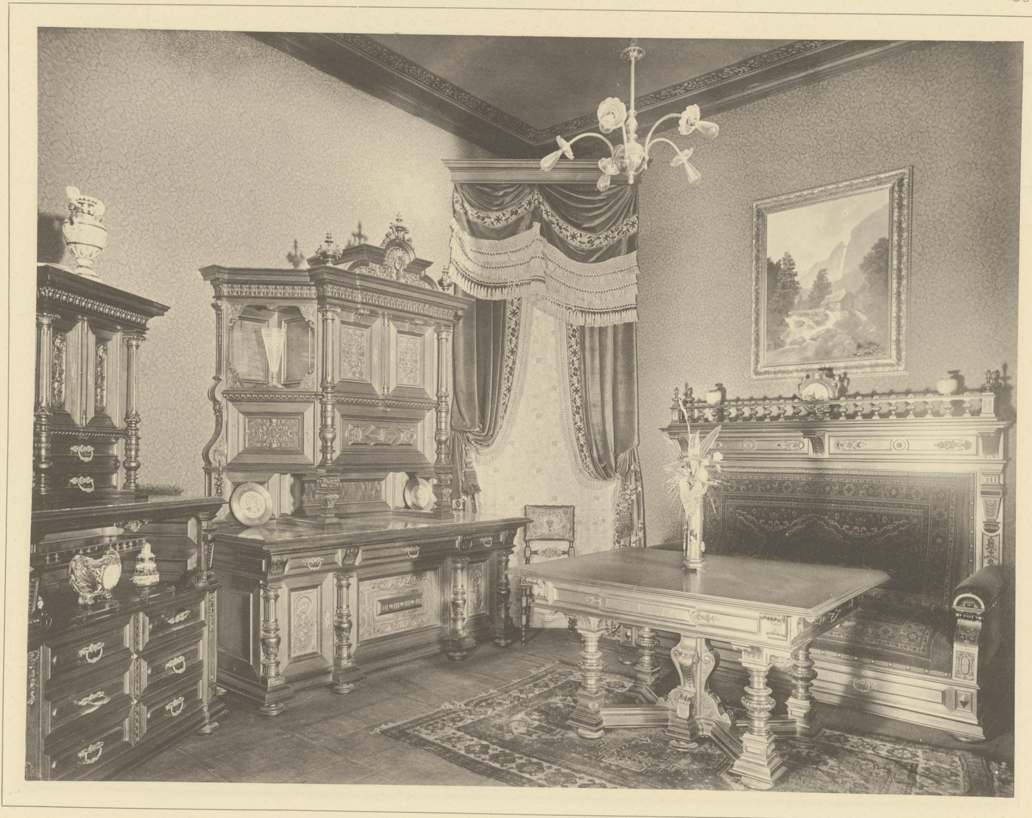
SPEISE-ZIMMER IN FRANZÖSISCHER RENAISSANCE