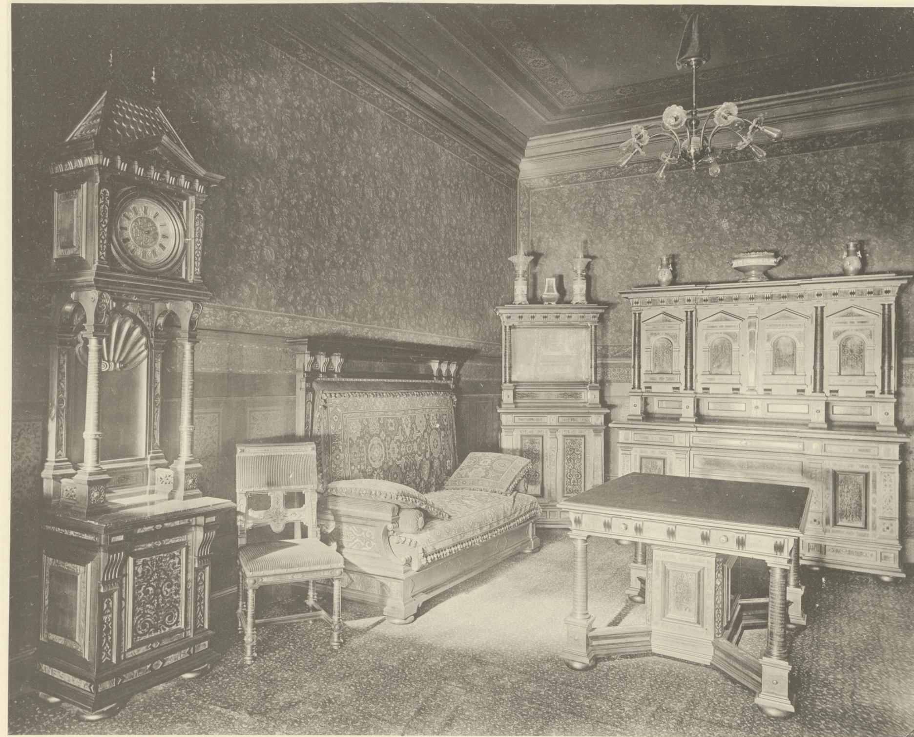
SPEISE-ZIMMER AUS NUSSHOLZ MIT INTARSIA-EINLAGEN