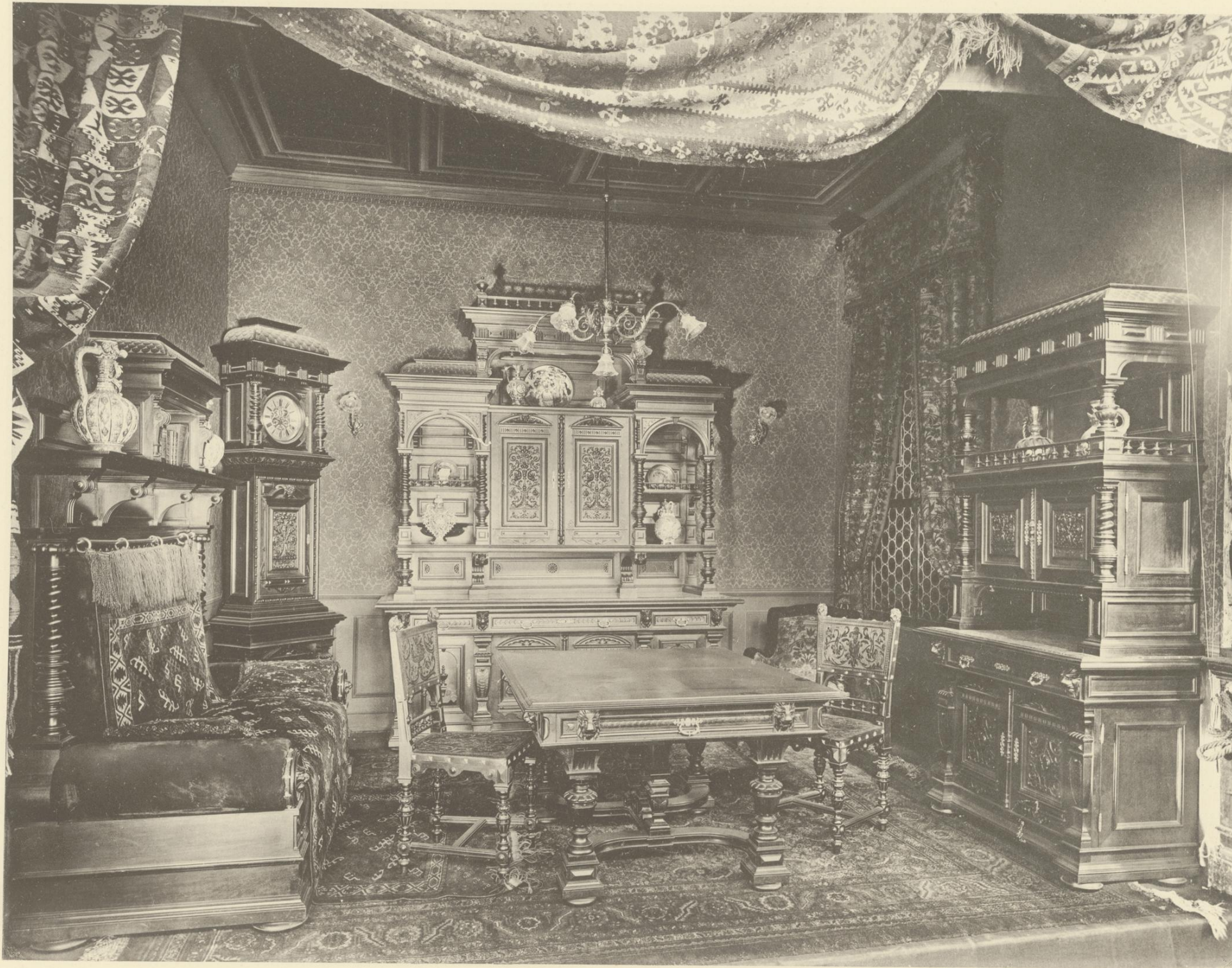
SPEISE-ZIMMER IN NUSSHOLZ, DEUTSCHE RENAISSANCE