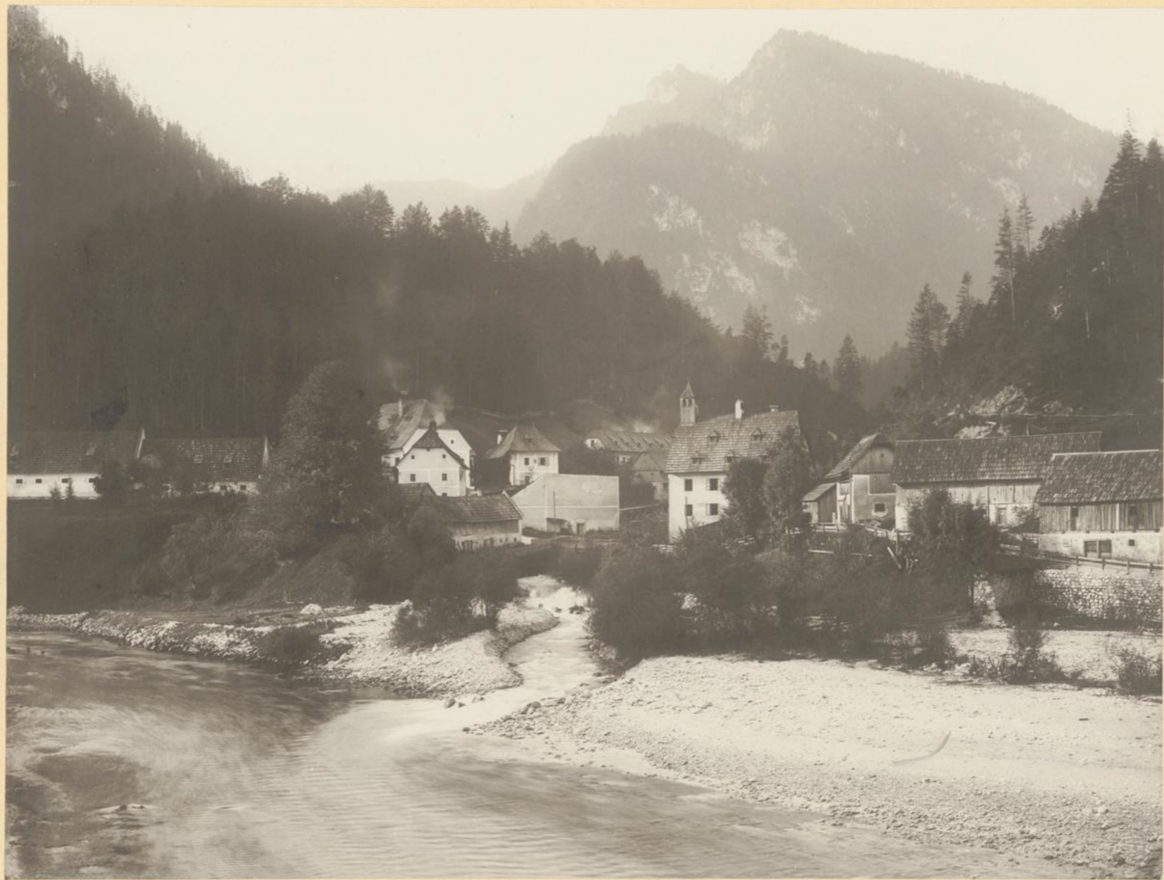
Einmündung des Seisenbaches in die Salza bei Wildalpe.