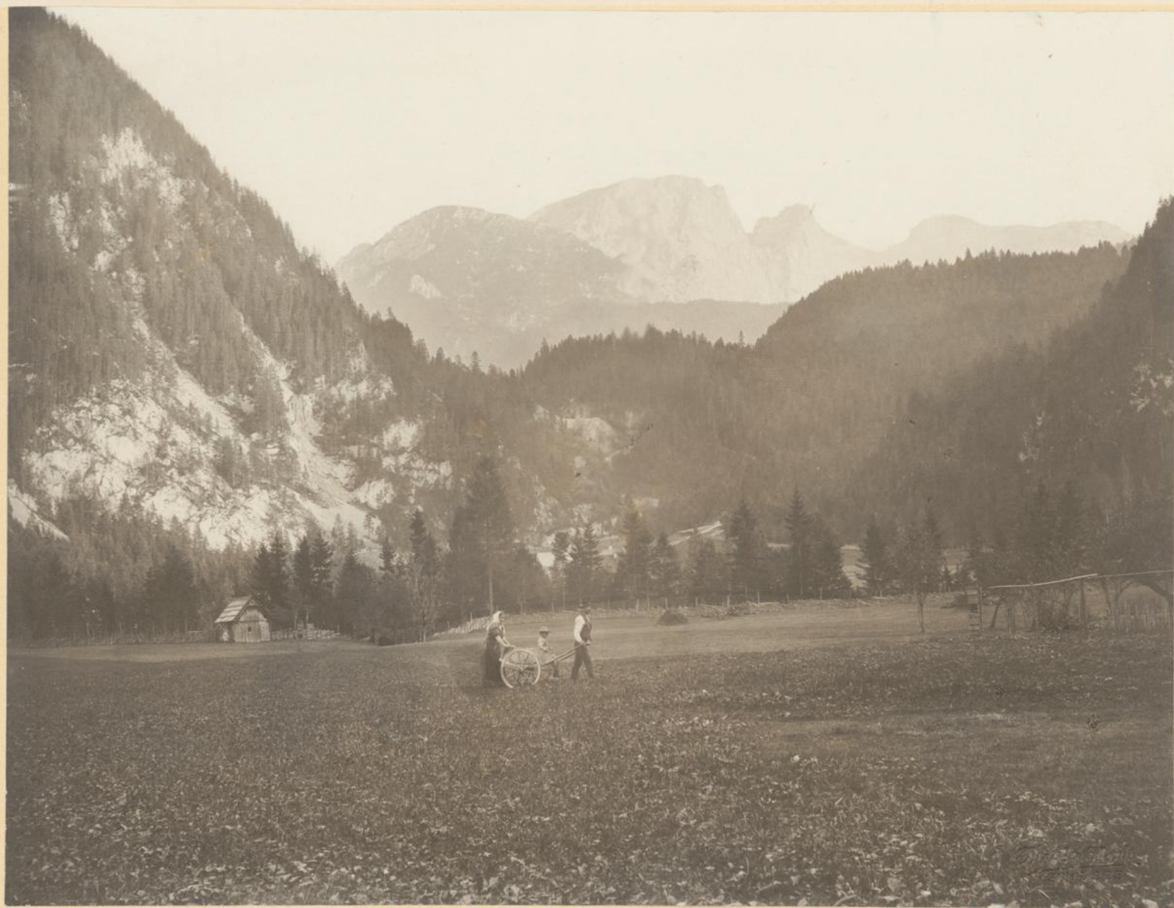
Blick vom festplatze der Grundsteinlegung auf den Griesstein und Ebenstein.