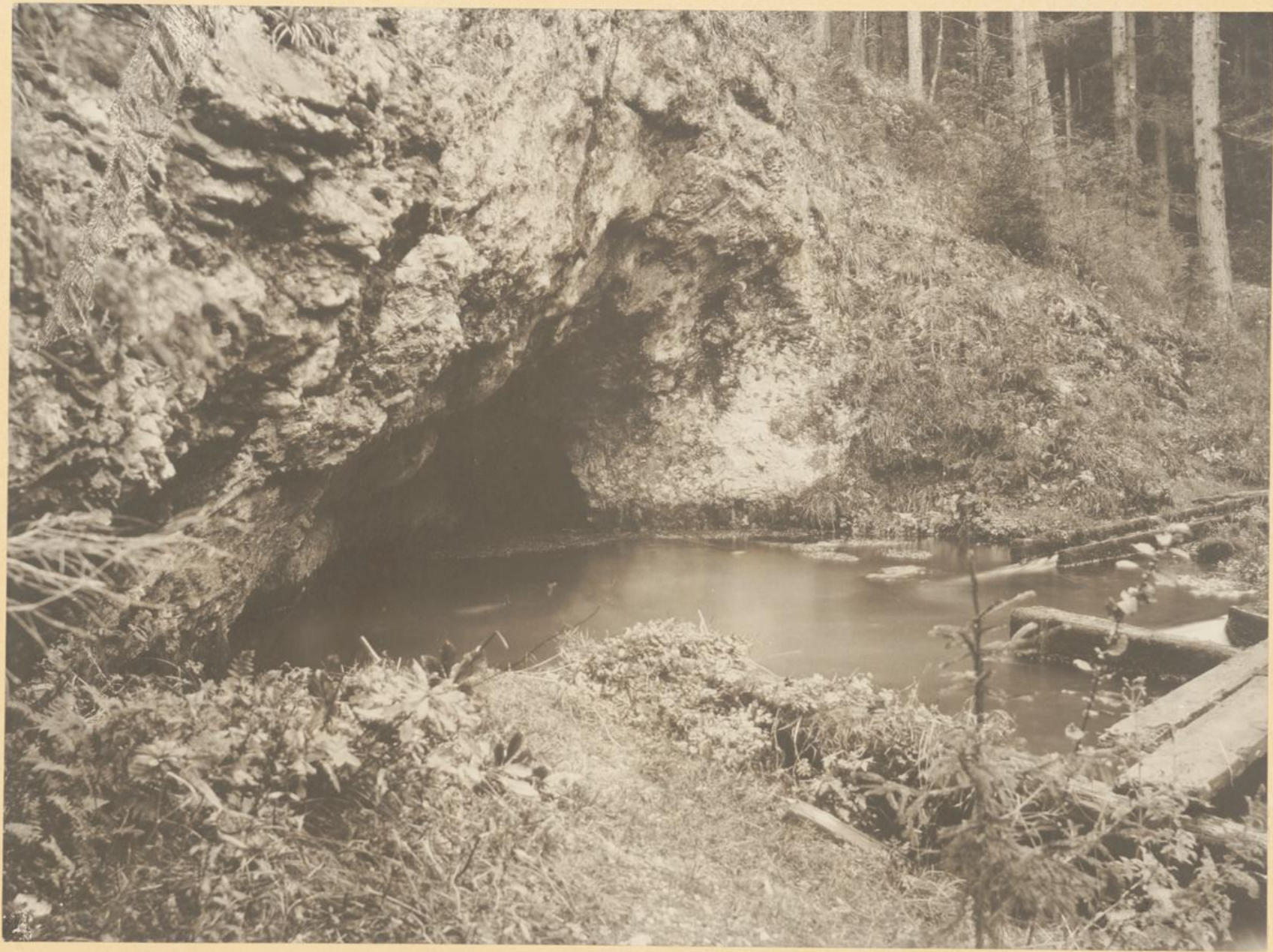
Ursprung der Brunngabenquelle.