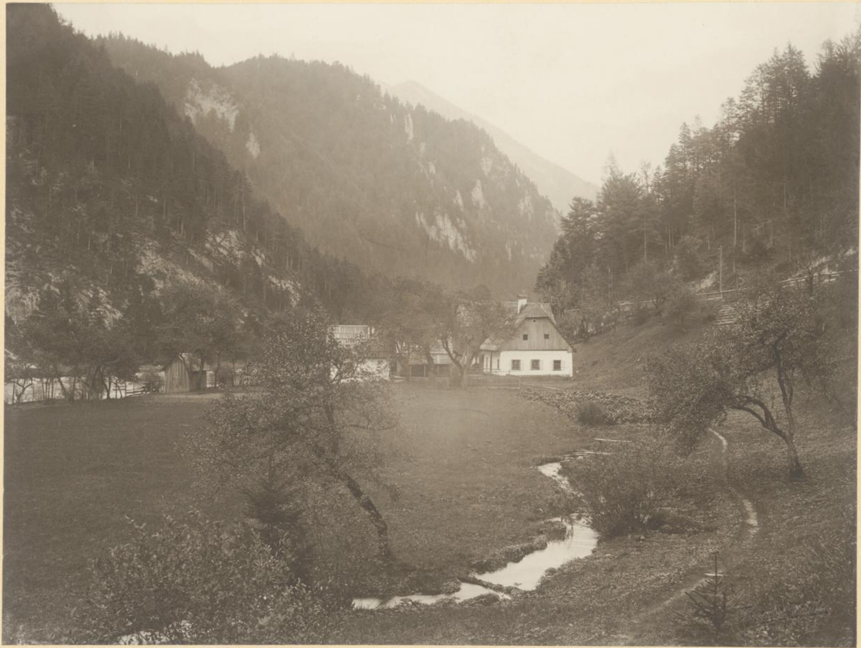
Die Seisensteinquelle mit der Kräuterin.