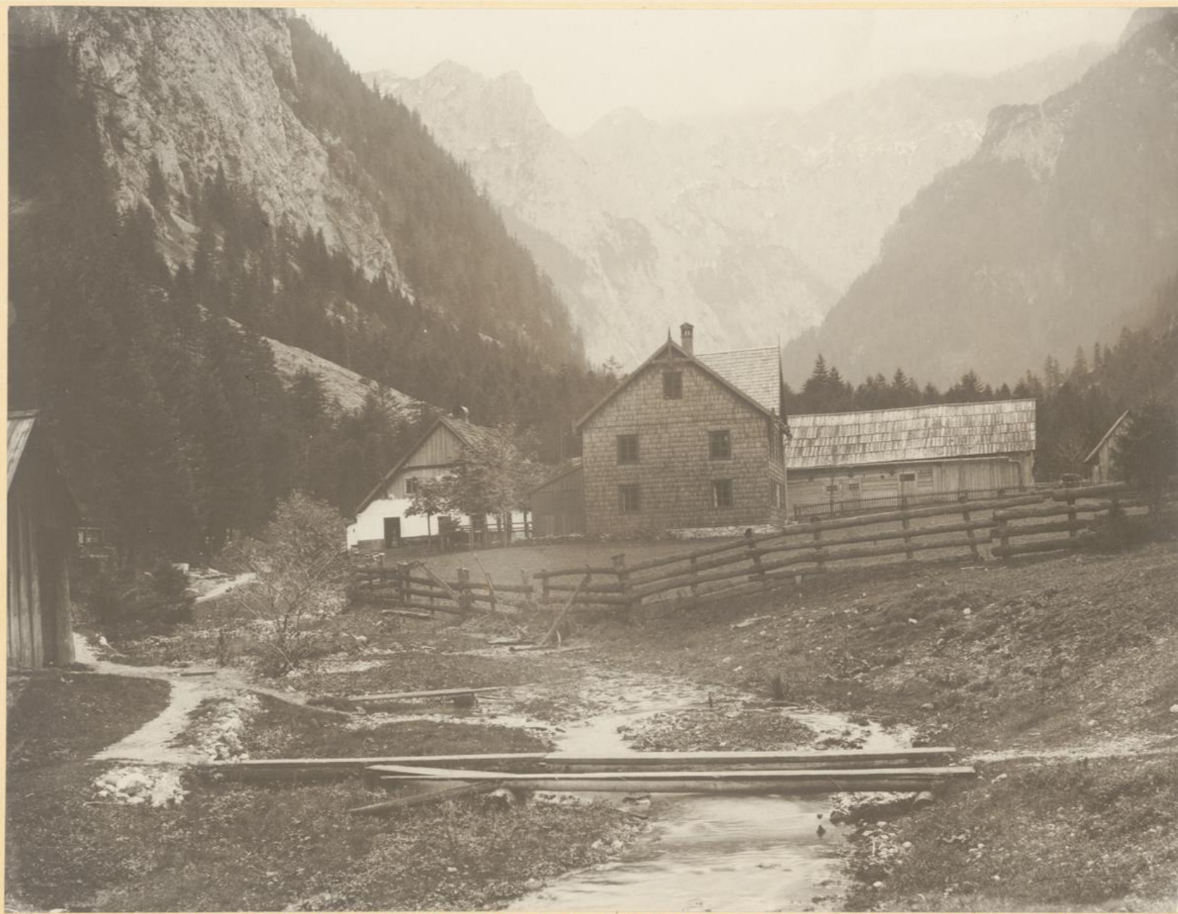
Ursprung der östlichen Höllquelle beim Schützenauer nächst Weichselboden.