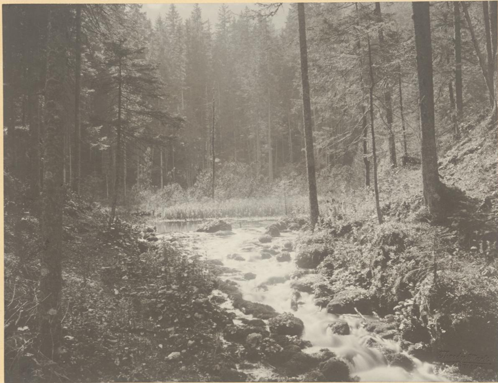
Der Waldsee im Siebensee-Gebiete.