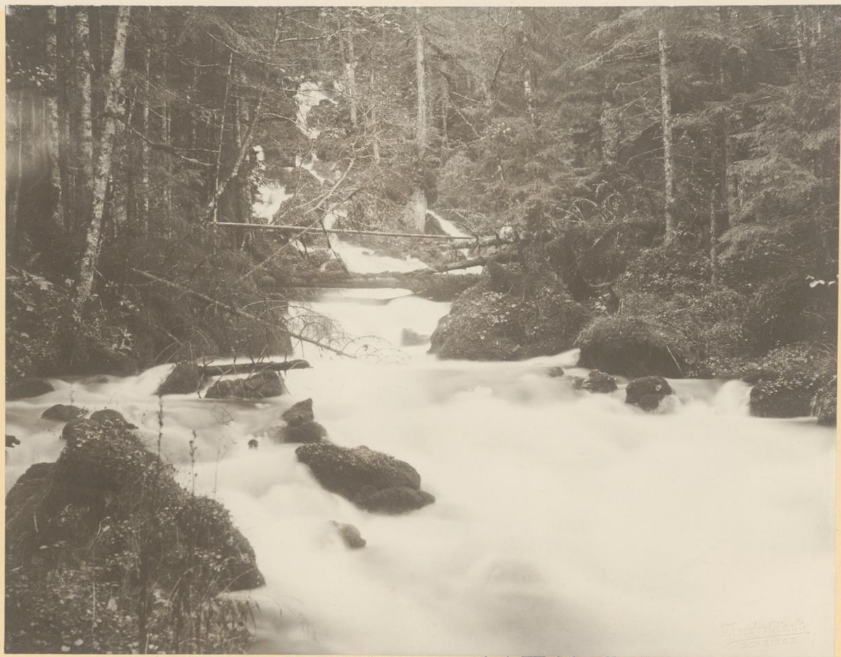
Seitenarm der Kläfferbrunnen bei Weichselboden.