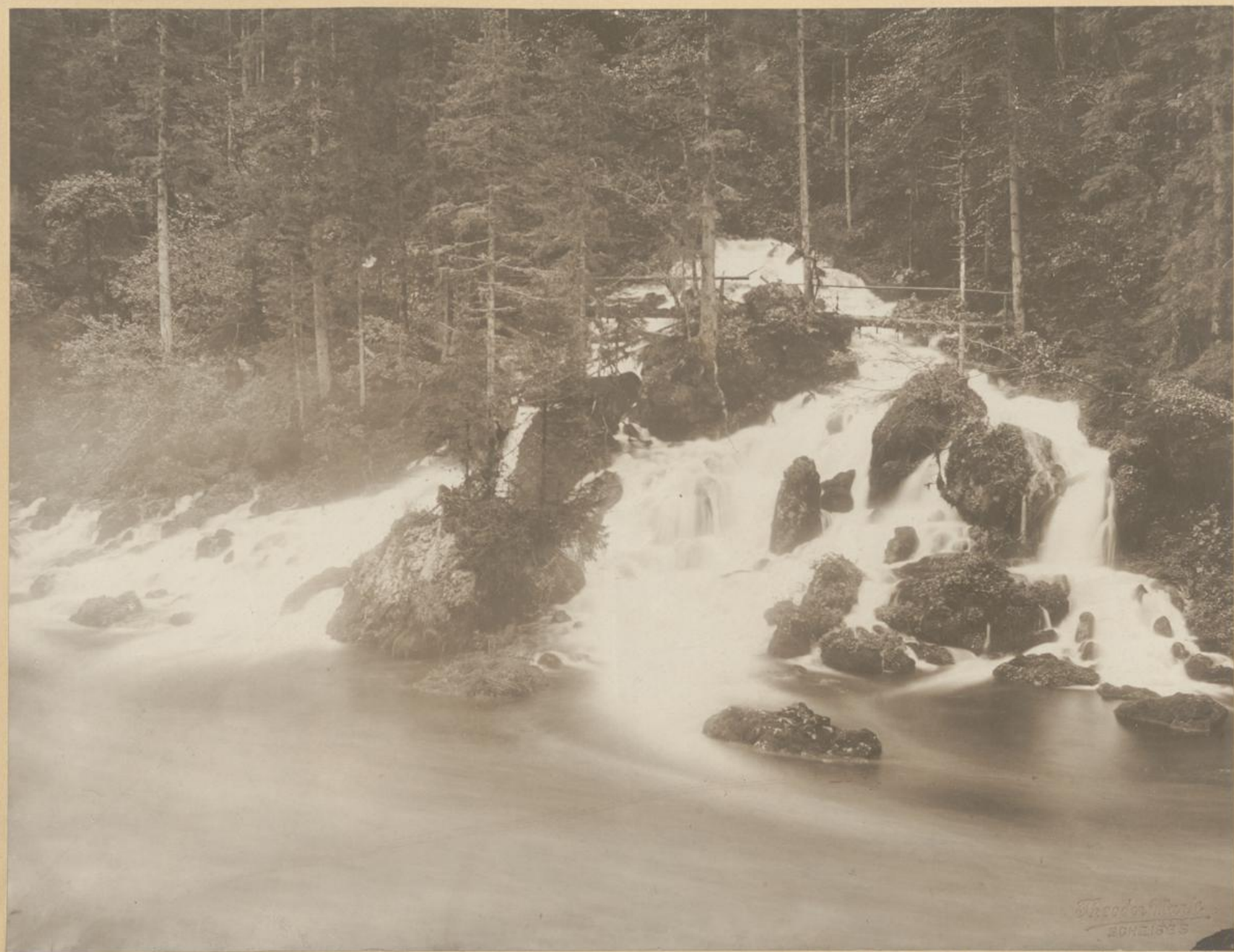
Hauptquelle der Kläfferbrunnen bei Weichselboden.