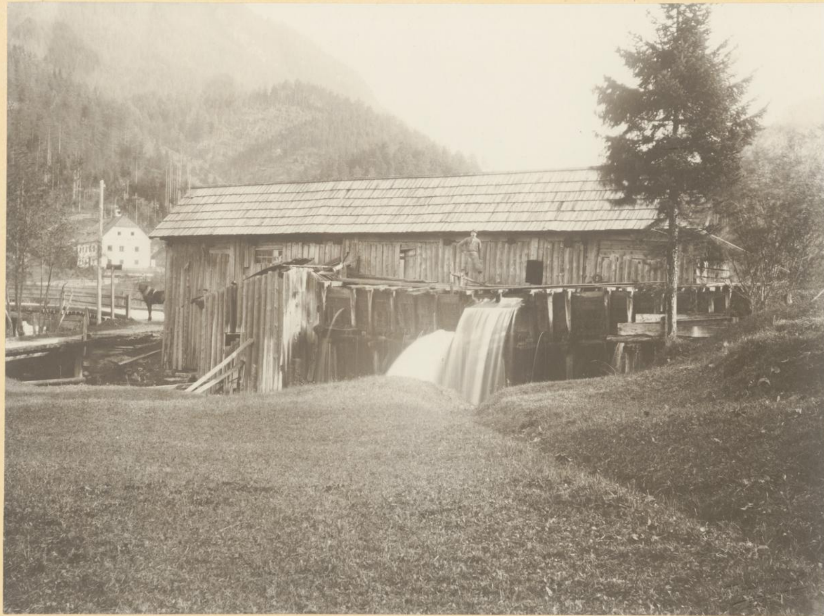
Die Klammersäge am Gleisnerbach an der Ausmündung des Brunngrabens.