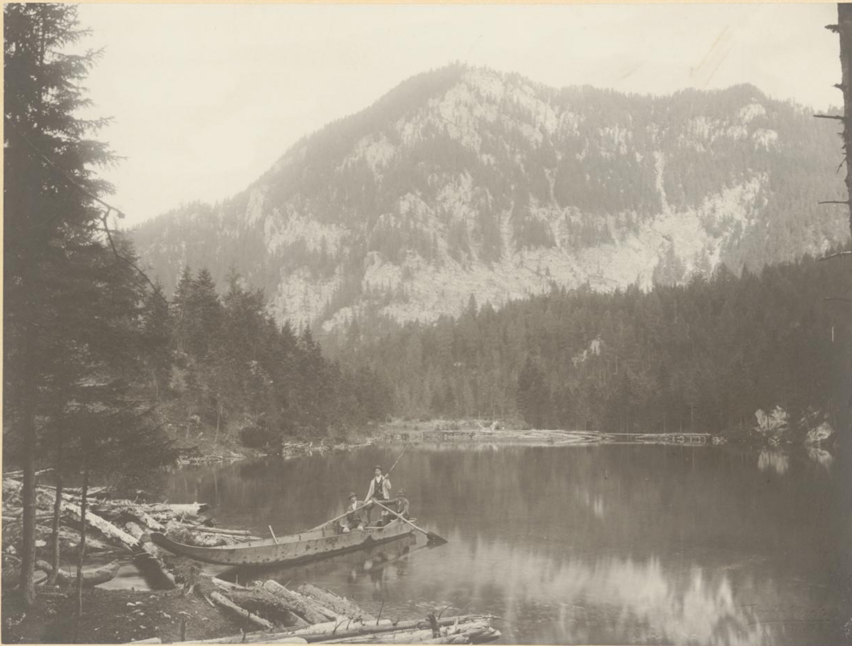
Der Kesselsee mit dem Seisenstein.