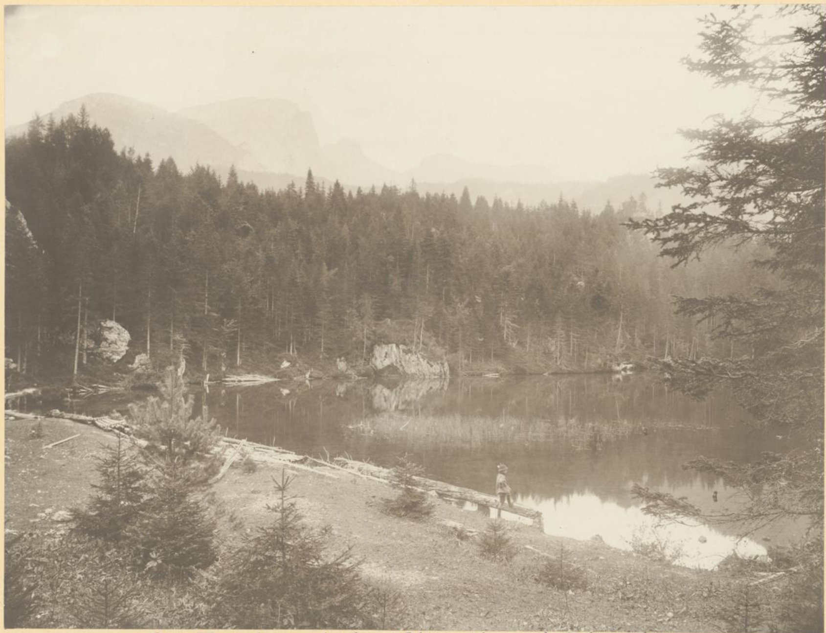
Der Kesselsee mit dem Ebenstein und Griesstein.