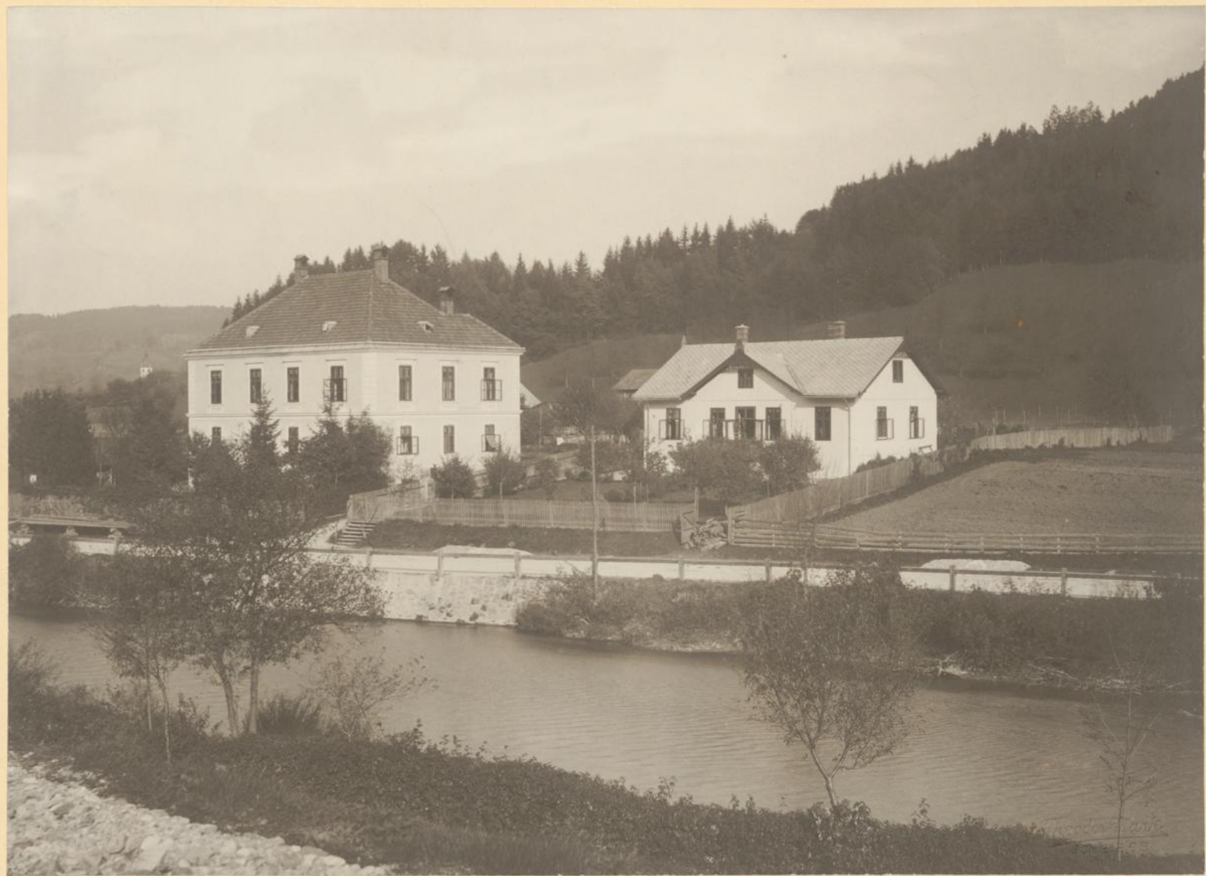
Sitz der Zentralbauleitung der II. Kaiser Franz Josefs Hochquellenleitung in Neustift bei Scheibbs.