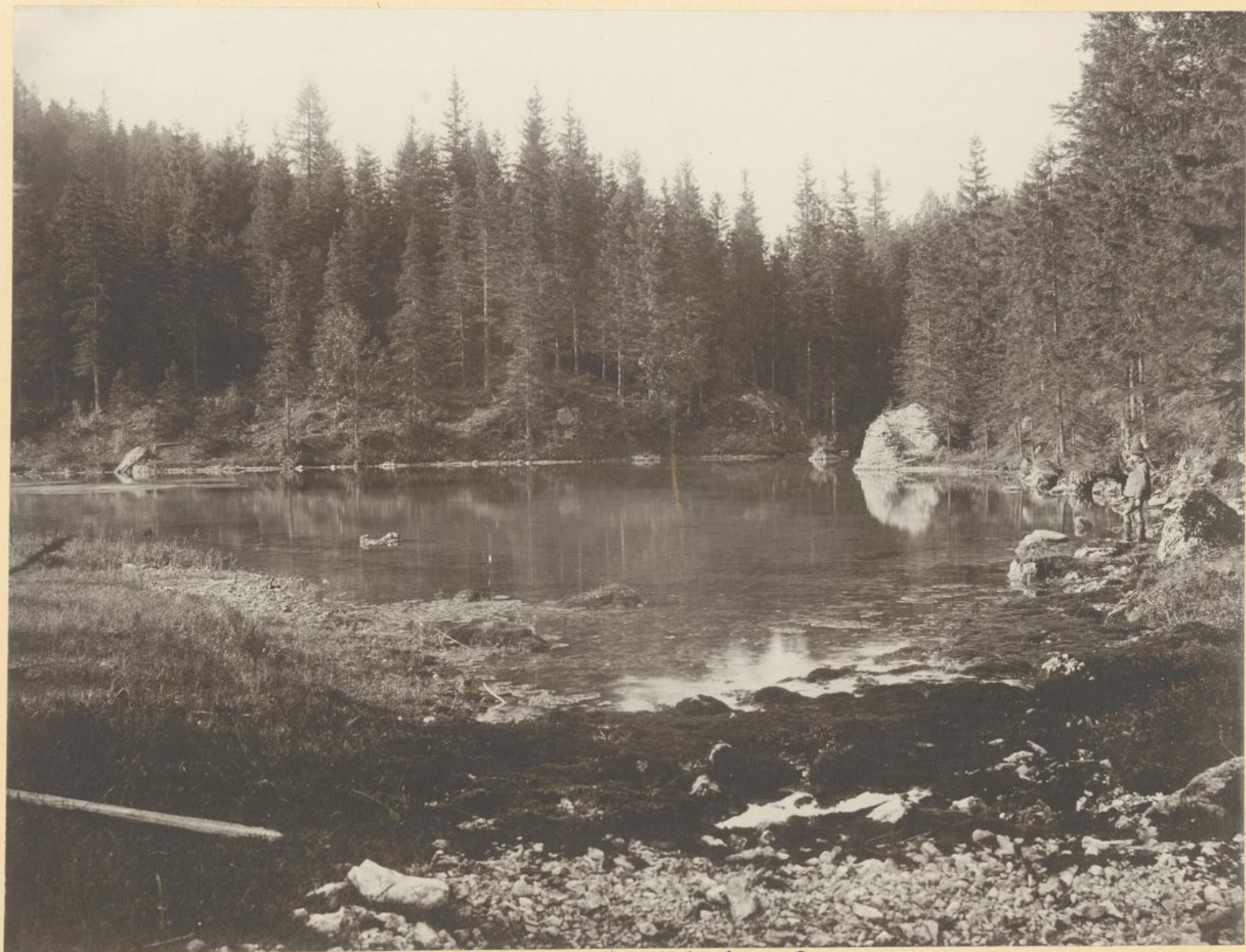
Der Roller- oder Lindner-See.