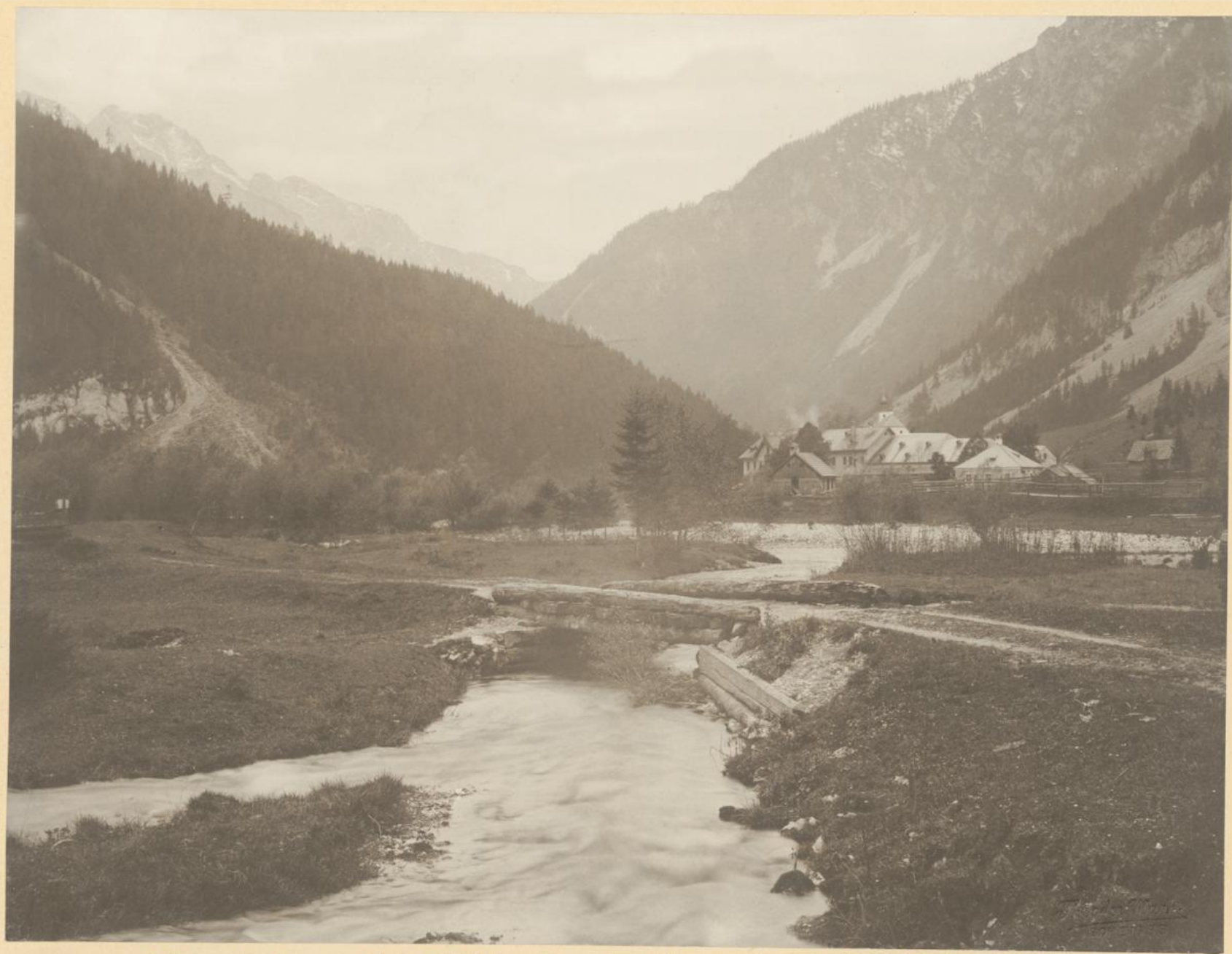
Einmündung des Höllbaches in die Salza bei Weichselboden.