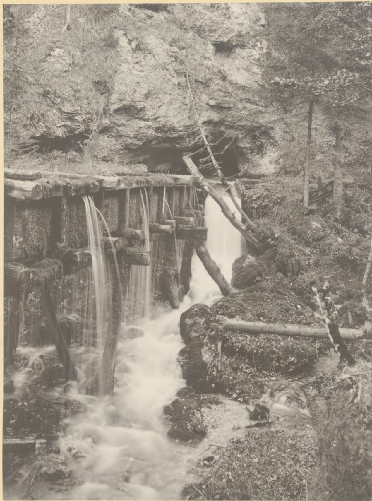
Abfluss der Brunngrabenquelle im Mühlgerinne.