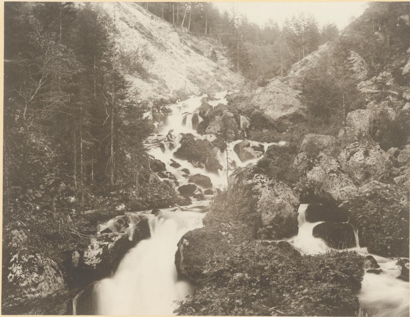
Absturz des Siebenseebaches.