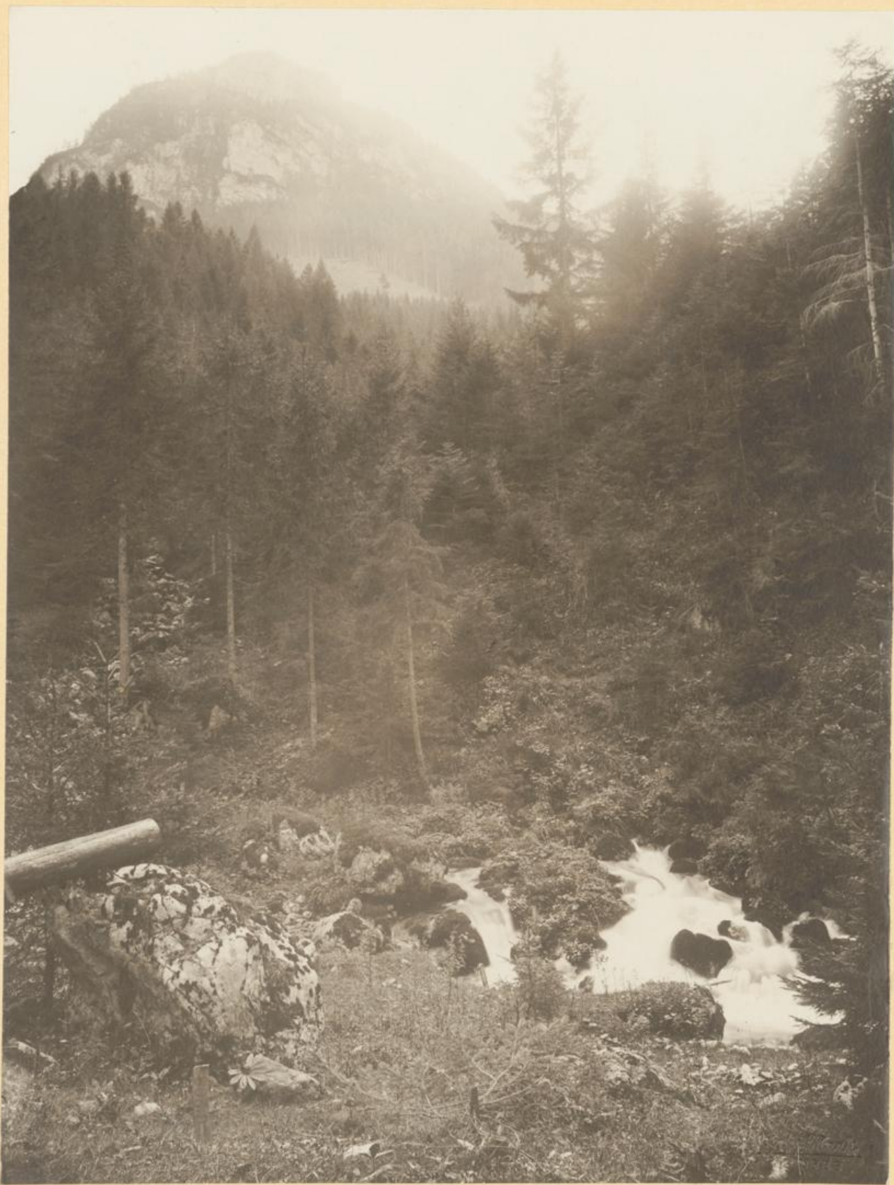
Ursprung der Schreierklammquelle bei Hinterwildalpe.