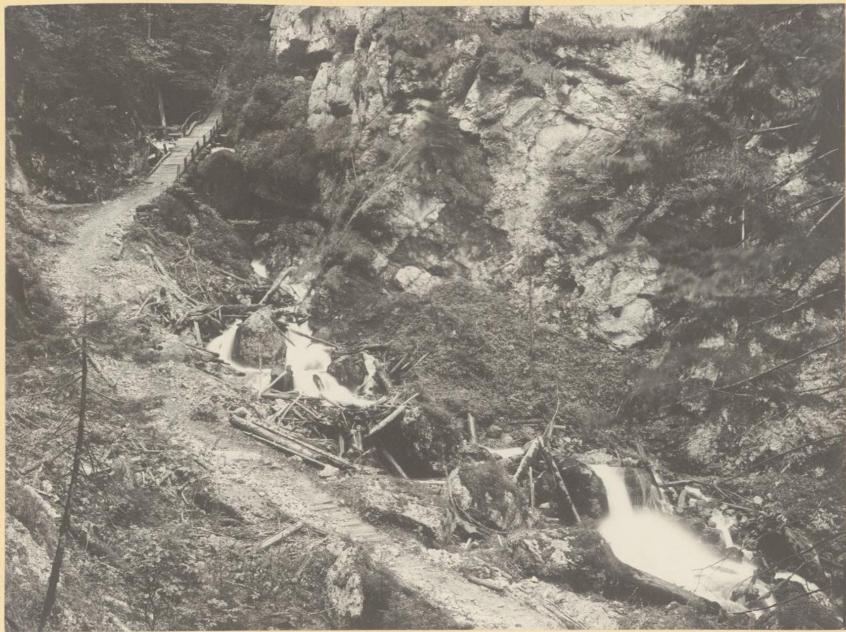
Eingang in die Schreierklamm.