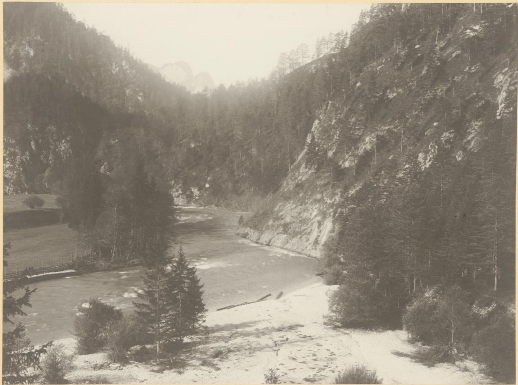
Standort des künftigen Aquäduktes bei Wildalpe.