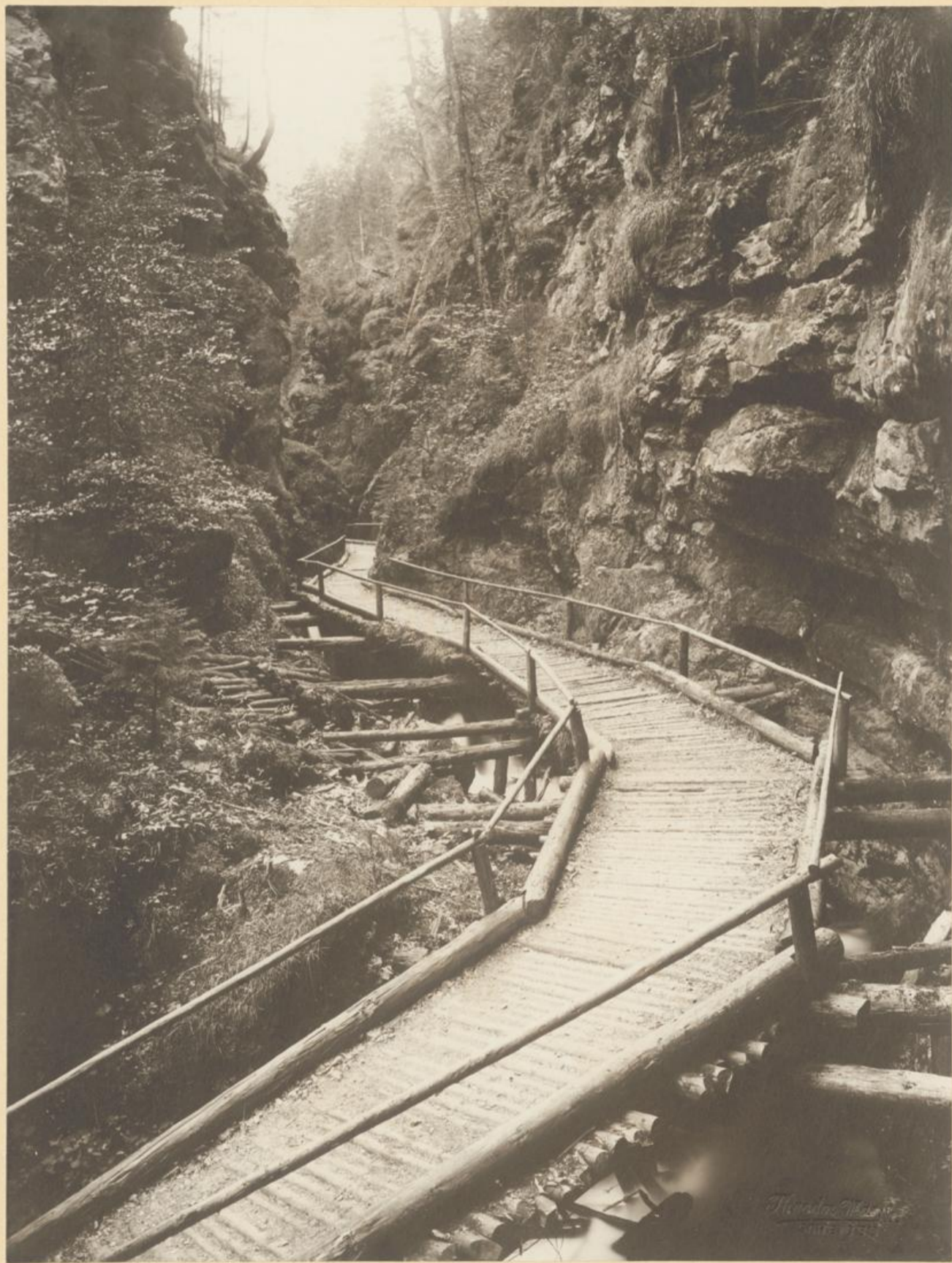
Die Schreierklamm bei Hinterwildalpe.