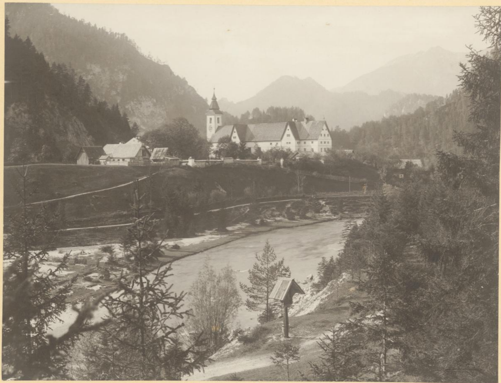
Wildalpe mit Hochkaar.