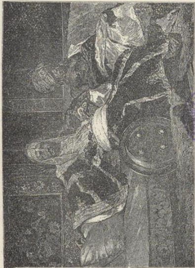
M. NIKE. M. NIKE. NIKE.