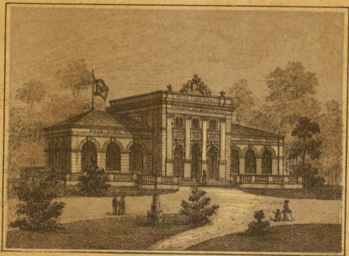
Neue freie Presse.