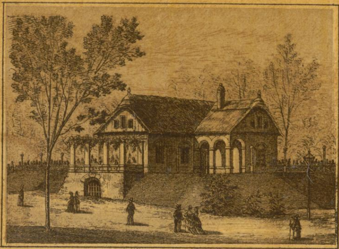
Czarda, ungarisches Weinhaus.