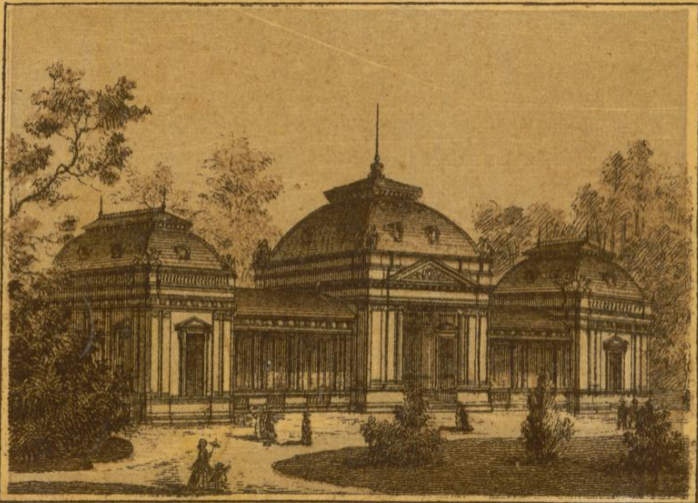
Kaiser - Pavillon .