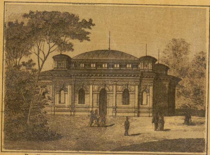
Pavillon der Donau-Dampfschiffahrts-Gesellschaft