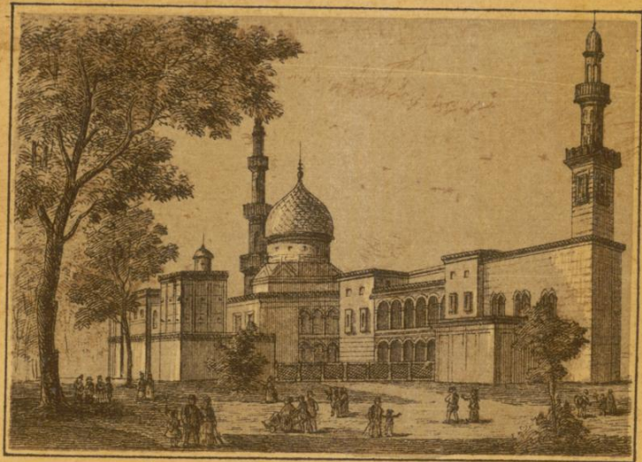
Pavillon des Vicekônigs von Égypten.