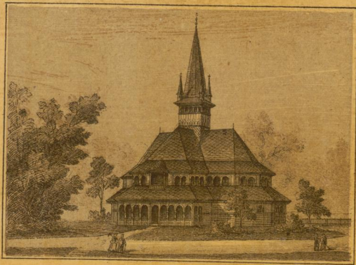
Königl. ungarische Forstverwaltung.