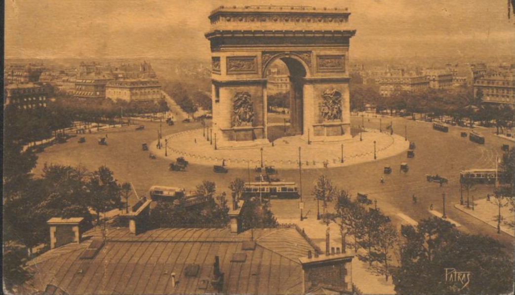
102 - PARIS - Place de l'Étoile - Arc de Triomphe