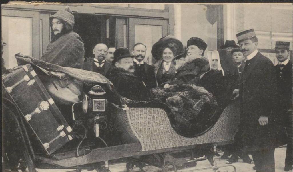
S. Exc. Dr. C. Lueger's letzter Besuch im Hotel Panhans 24. Februar 1909 - Semmering.