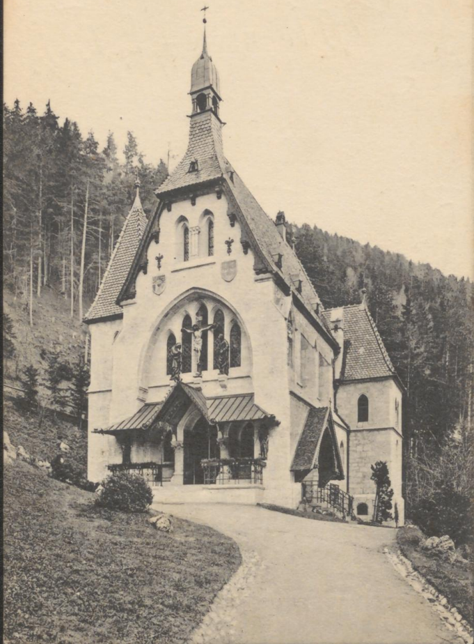
Höhenluftkurort Semmering , 1000 m Seehöhe, N.-Oe. Semmering-Kirchlein.