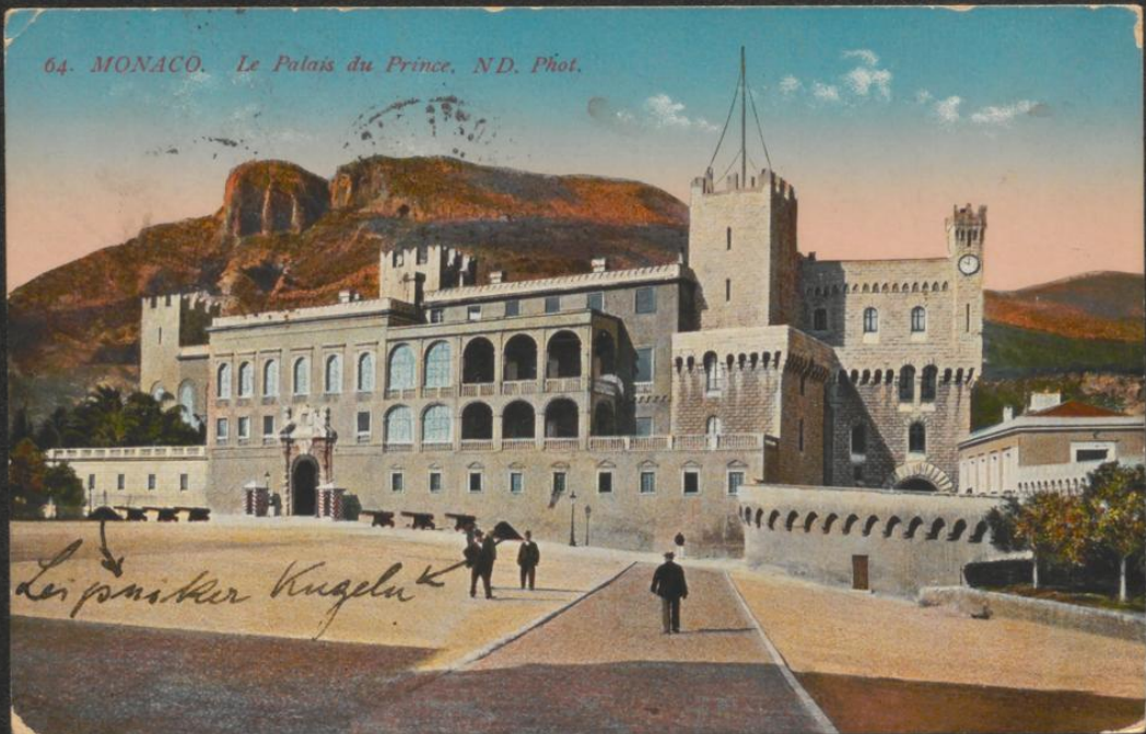
64. MONACO. Le Palais du Prince.