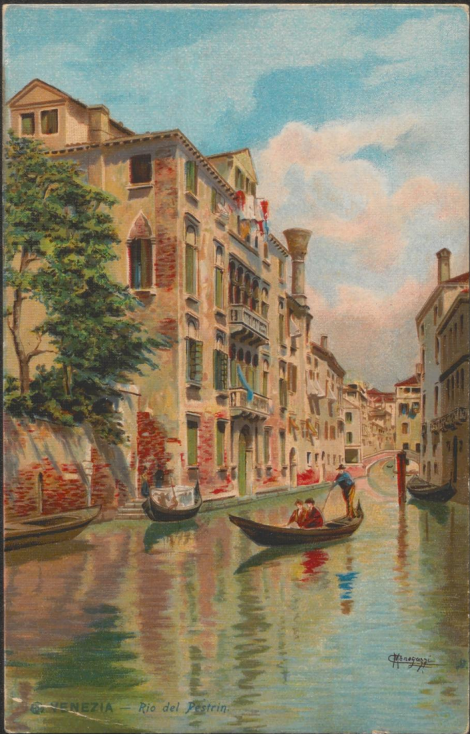
VENEZIA — Rio del Pestrin.