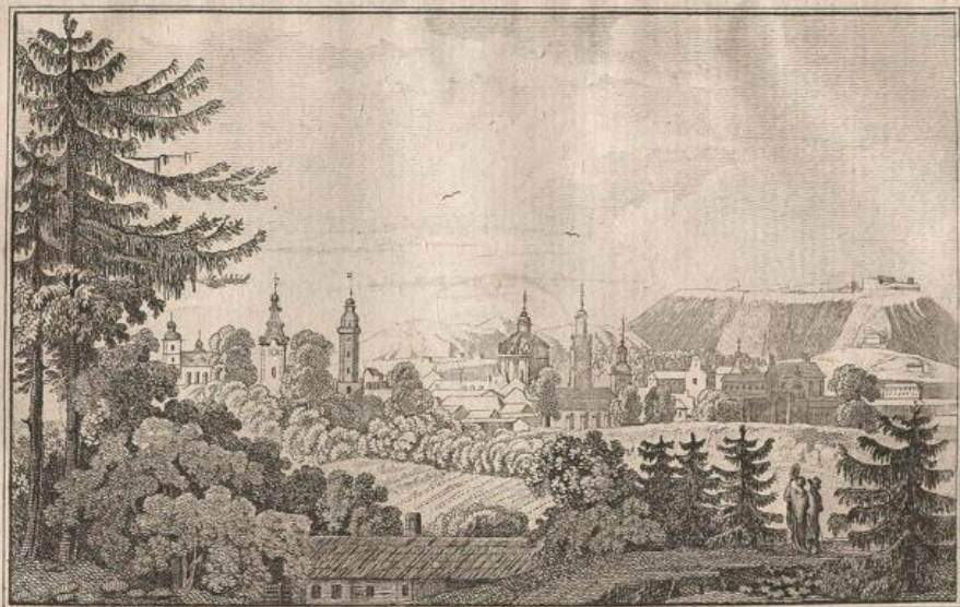
Ansicht von Lemberg.