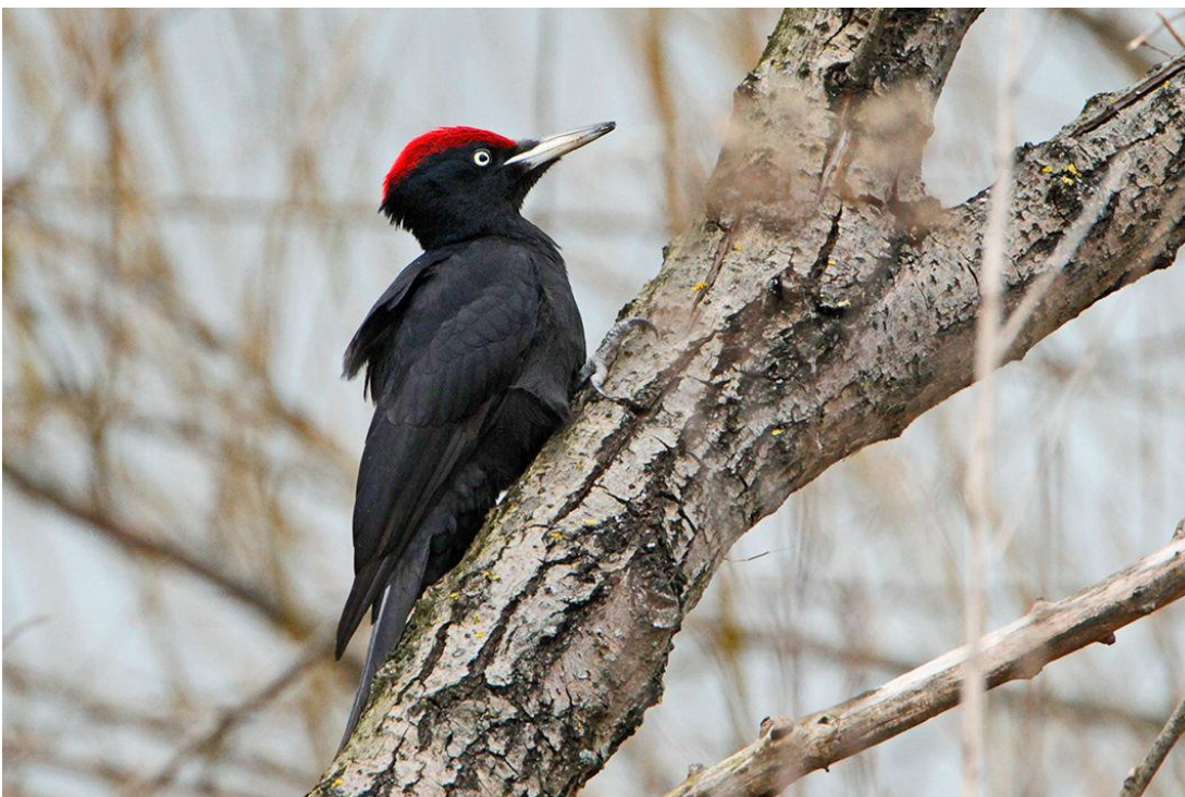
Schwarzspechtmännchen, Donauinsel

Selbst kleine grüne Inseln sind im urbanen Häusermeer für das Vorkommen und Überleben der Vögel wichtig! So das Endergebnis der Spatzen- und Spechtzählung 2020 bis 2021.