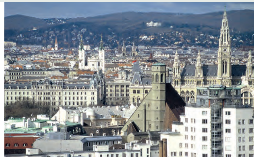
Wien, Blick gegen Westen