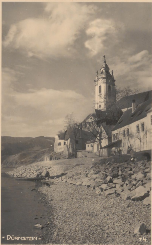
- DÜRNSTEIN -