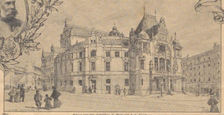
Erbaut von den Architekten H. Stiel und S. v. Krieh