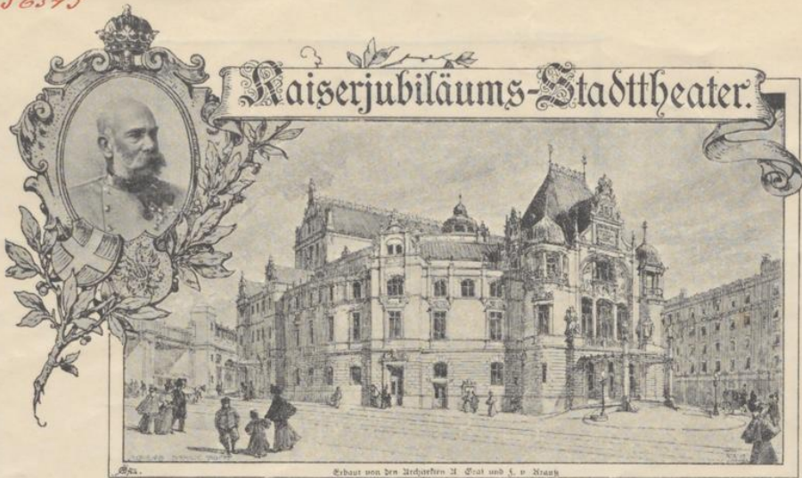
Erbaut von den Architekten H. Groll und L. v. Mautz