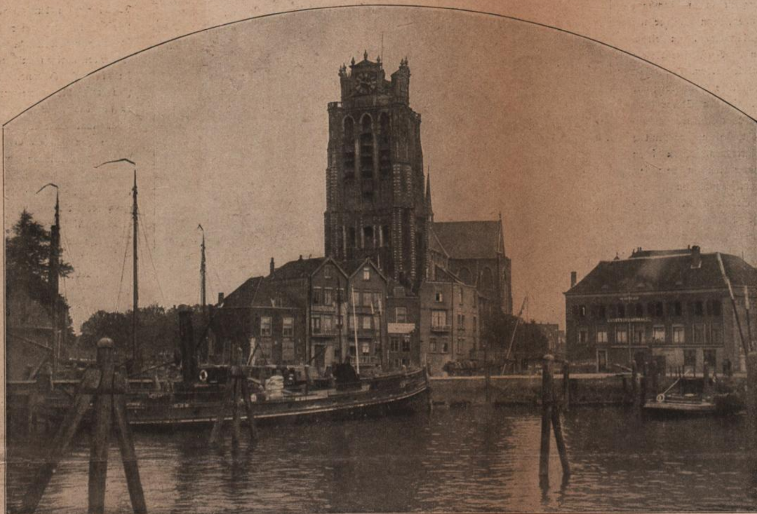
Die holländische Stadt Dordrecht an der Rheinmündung, der eine Endpunkt des geplanten Rhein—Donau-Kanals.